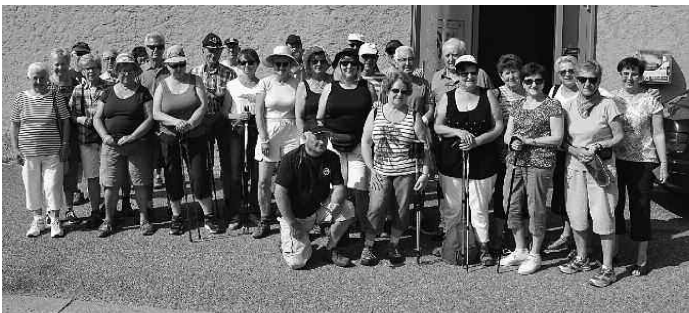
Les marcheurs prêts à partir

Du 6 au 10 juin 2017 : 112 participants au voyage dans les Dolomites avec un concert des Geschwister Niederbacher.