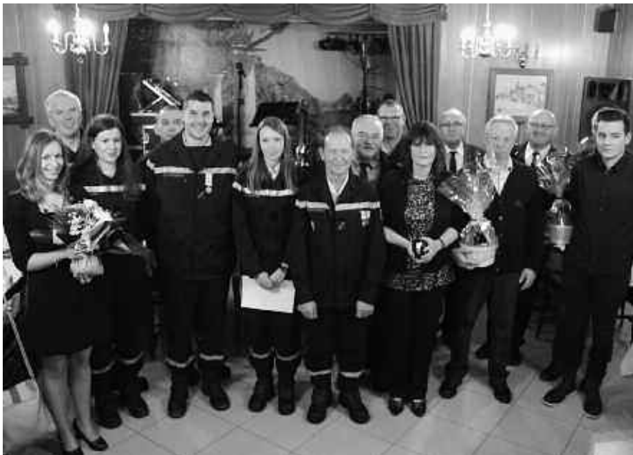
Fête de la Sainte Barbe au Lion d'Or

2018 vient de débiter et il est donc l'heure de faire le bilan de l'année écoulée.