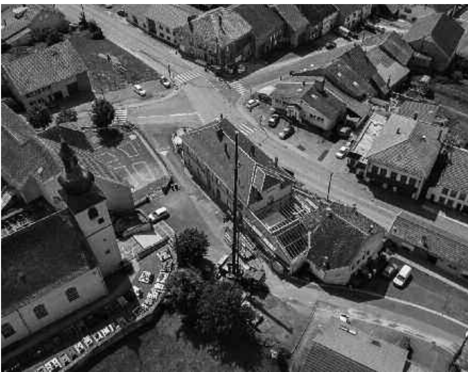
L'école maternelle durant les travaux

La revalorisation et sécurisation du centre du village : le projet de revalorisation et de sécurisation du centre du village consiste à revoir l'aménagement urbain et paysager de la rue de l'Eglise et au niveau du croisement central de la commune (RD43 - RD94). Il comprend 4 volets :