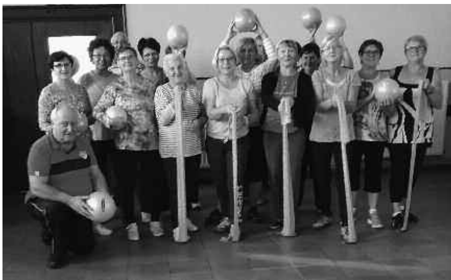
Les séances de gym douce

Le 08 octobre 2017 : Repas retrouvailles des participants au voyage du mois de juin avec diaporama des photos du voyage dans les Dolomites.