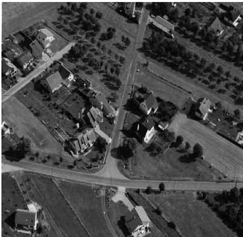
Cette vue à valeur documentaire de 1995 montre l'évolution de l'extension du village qui par le phénomène de "mitage pavillonnaire" menace l'équilibre des prés-vergers datant d'une évolution antérieure

Quel pesticide est aussi efficace et si peu cher ? Certes tout