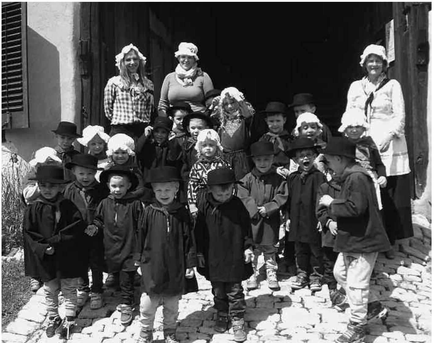
Les enfants en costume d'époque