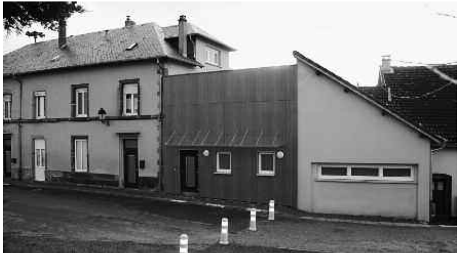
L'école maternelle après travaux