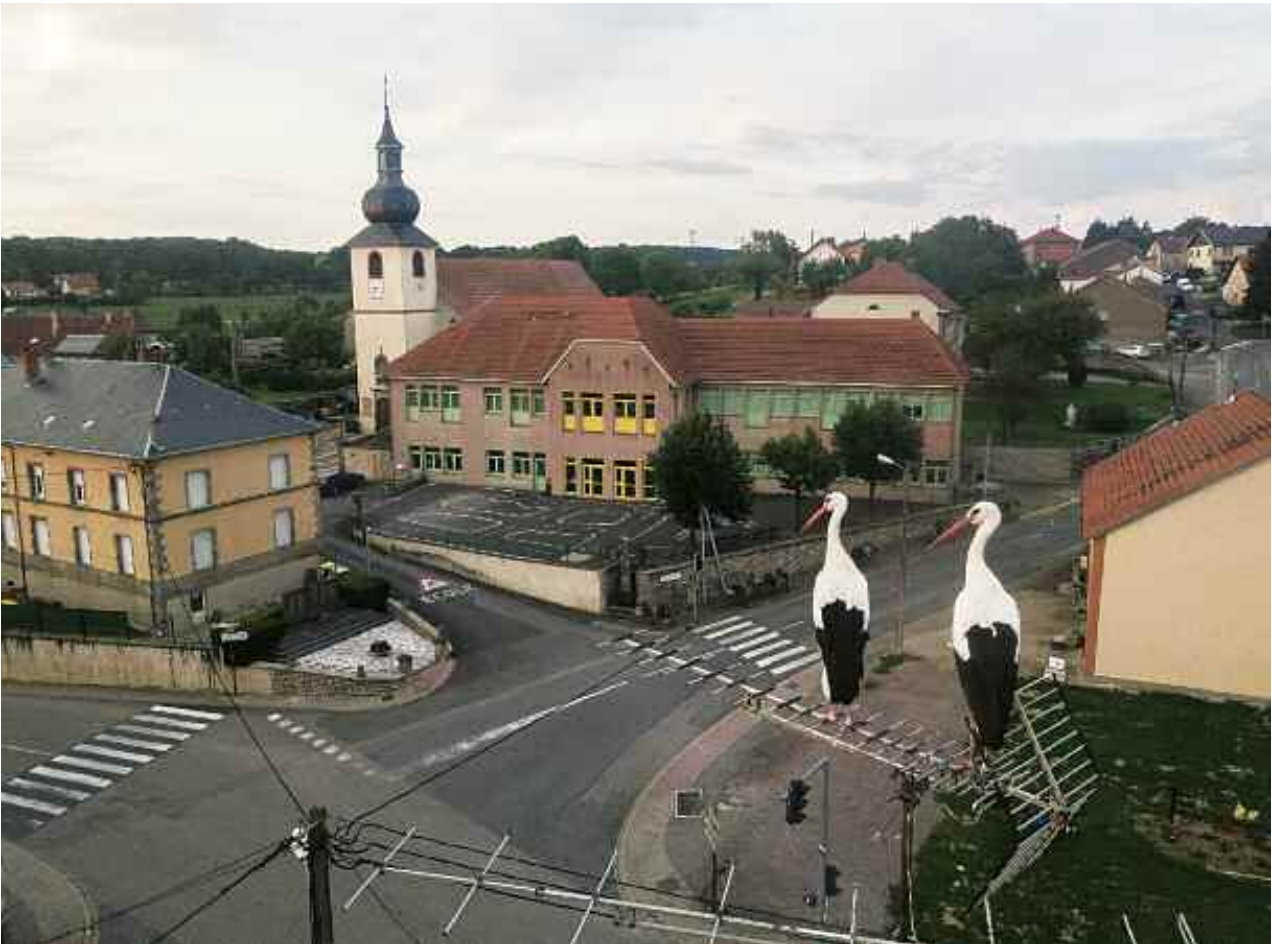
Photos : Arnaud THIRY. Les cigognes observent les feux rouges... Cidessous, vue aérienne du centre du village

La photo de couverture a été réalisée par Arnaud THIRY