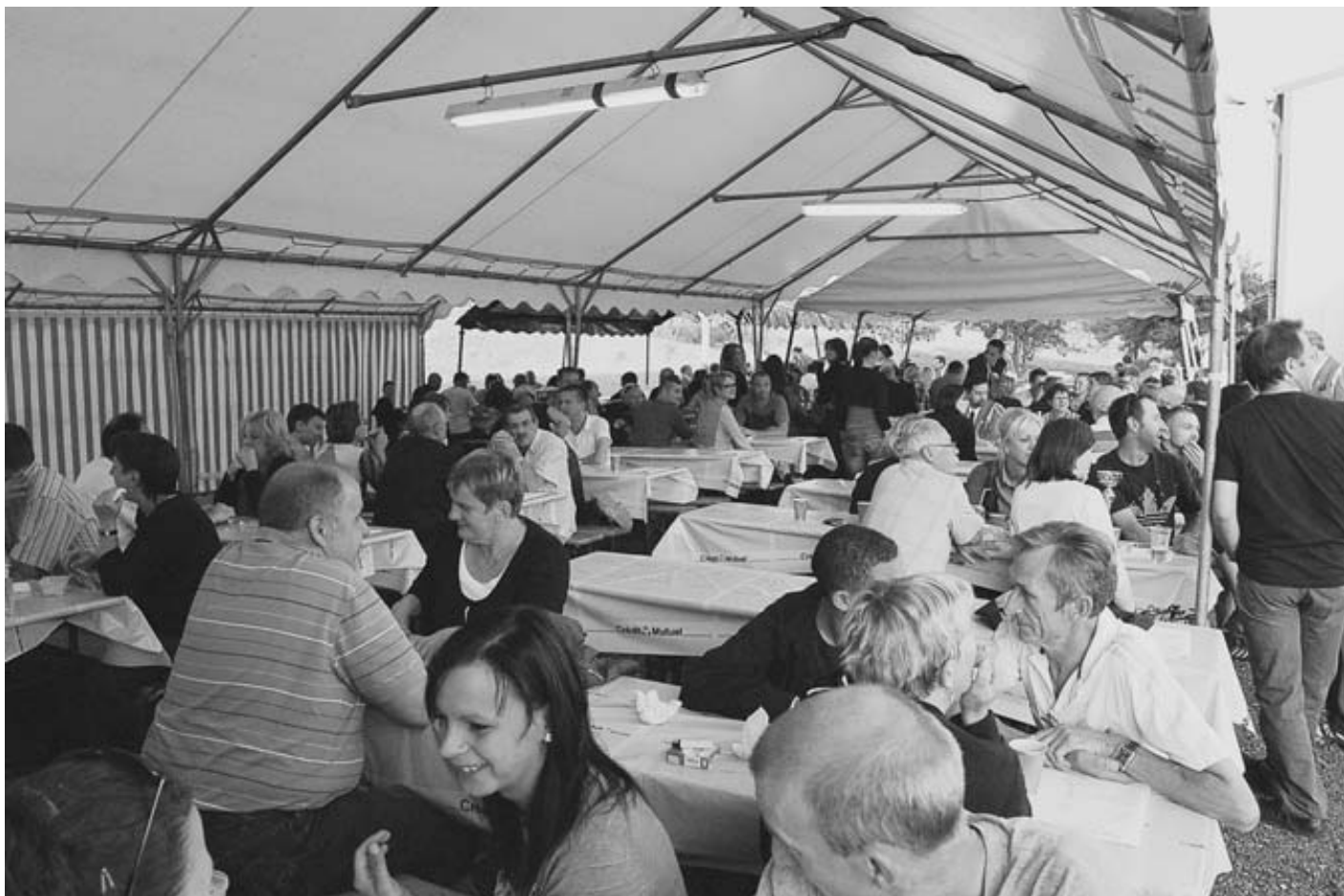
La fête des pompiers à Sarraltroff