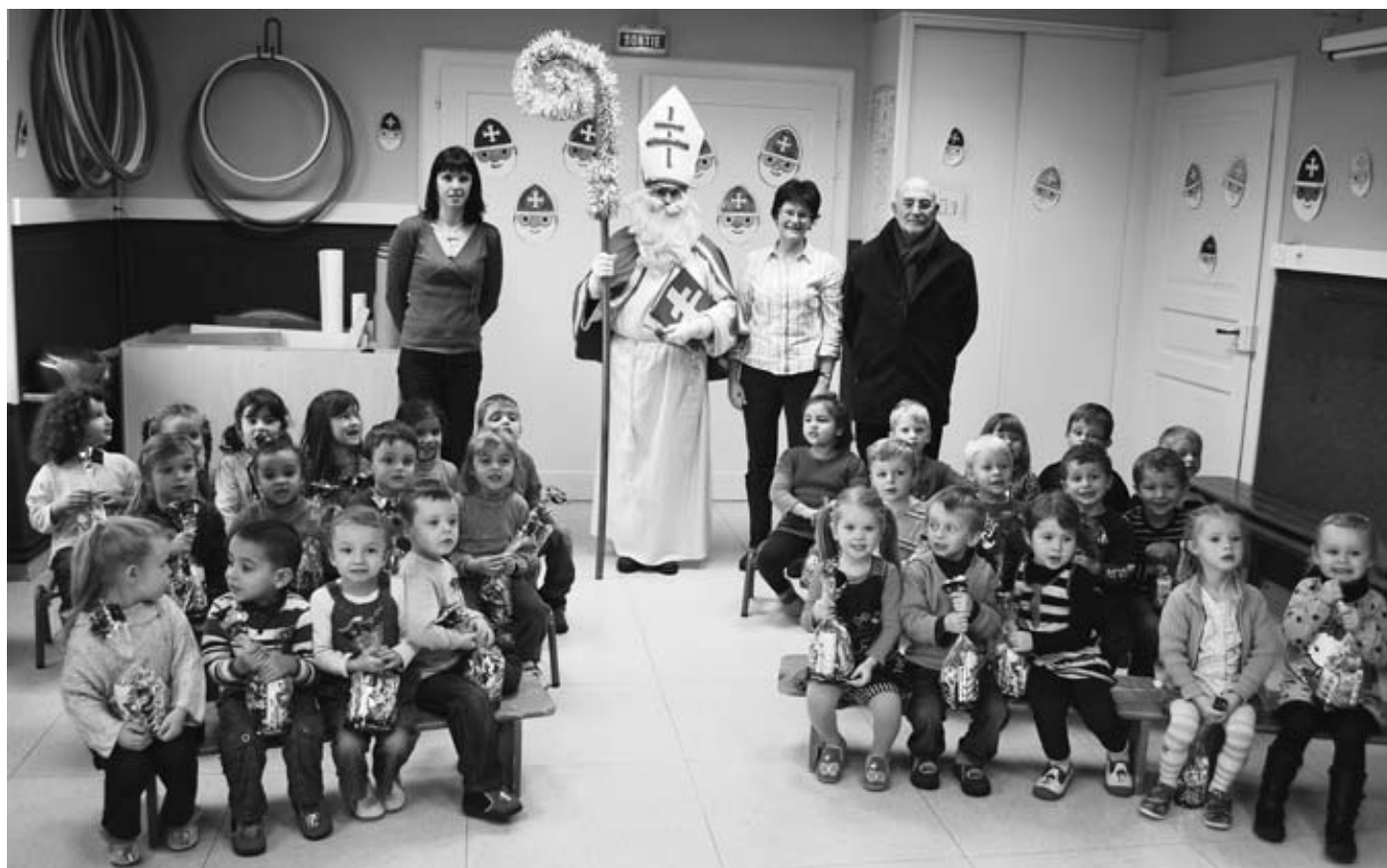
Visite de Saint Nicolas à l'école maternelle