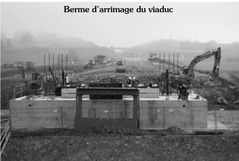
Berme d'arrimage du viaduc