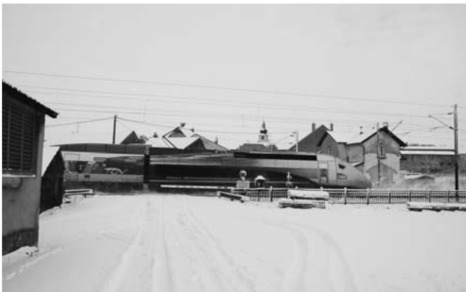
Le TGV du record du monde 574,8km/h traverse Sarraltroff