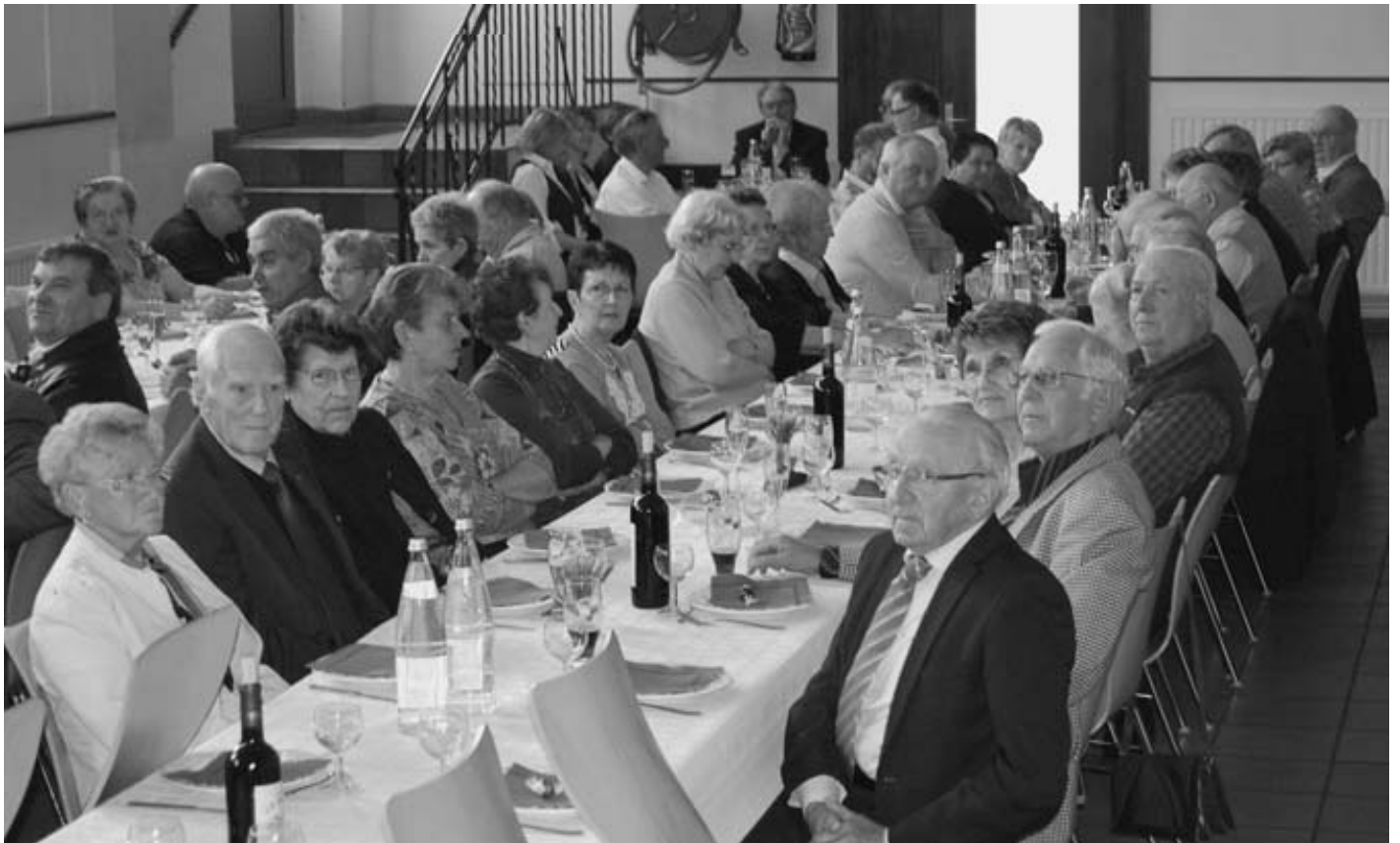
Les aînés hôtes de la municipalité pour le repas annuel