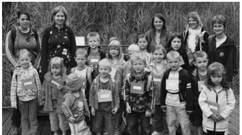
Centre aéré groupe nature

Sainte Croix : découverte de nombreux animaux, activités autour de la biodiversité et promenade en petit train.