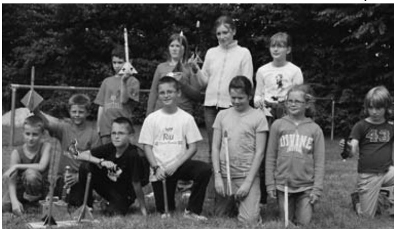
Centre aéré groupe microfusées