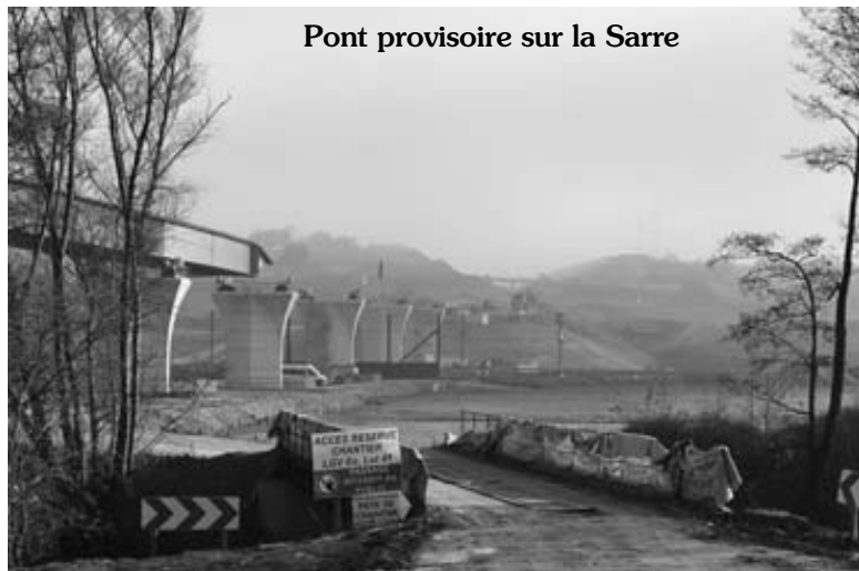
Pont provisoire sur la Sarre