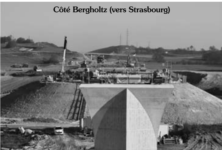
Côté Bergholtz (vers Strasbourg)