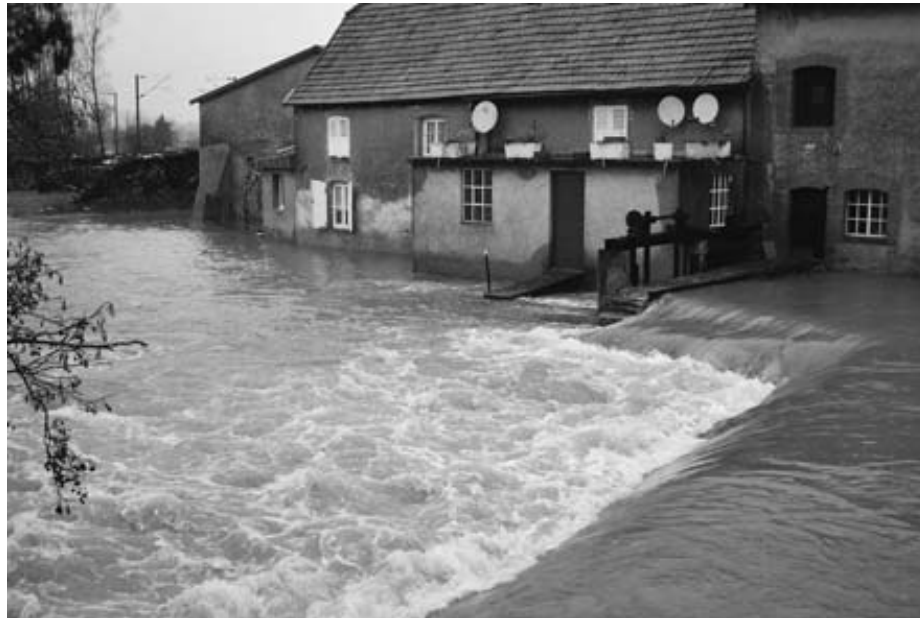
La Sarre en crue à Sarraltroff

chemins nouveaux et un nouveau parcellaire. La mise en place des nouvelles bornes a commencé en avril 2011, la réattribution des nouvelles parcelles s'effectua le 1er novembre après les récoltes et le ramassage des fruits le 1 er décembre. Le coût des travaux connexes s'élève à 1.202.531 euros HT et devrait se répartir entre RFF (70%) la Commune (20%) et l'Association Foncière (10%). A cela, il faut rajouter un programme de plantations de 6 hectares de forêts pour 25.530 euros, financés par RFF, dont 4.000 euros pour la restauration de la mardelle du Bergholz.