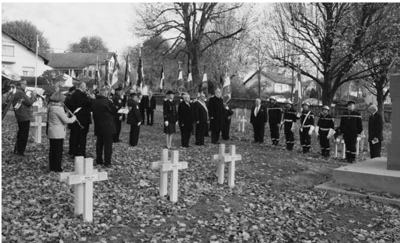
Ceremonie du 11 novembre au cimetière militaire