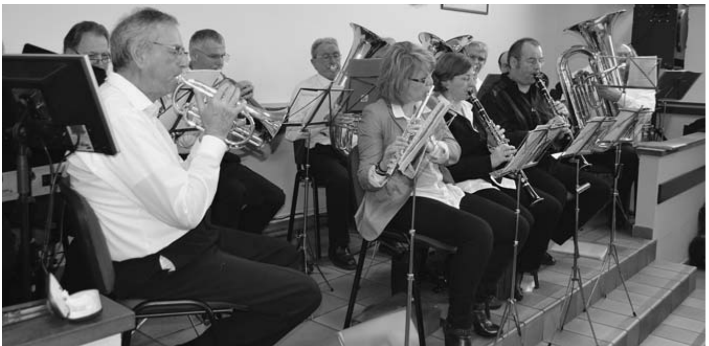
Repas des aînés animé par la musique du Foyer Saint Michel de Sarraltroff

Suite à la construction de la route nationale, la route de Réding à Sarraltroff, qui, à hauteur de la fontaine Oblinger se bifurque à Eich et passe à mi-hauteur, perdit son utilité. En fait cela ne se révéla pas immédiatement mais seulement au 19 e siècle, quand une nouvelle route fut créée en prolongement de celle qui venait de Buhl pour aller à Hoff (et de là à Sarraltroff) Cette voie de passage est aujourd'hui dénommée « alter Weg » (le vieux chemin) et n'est plus empruntée par les habitants de Sarraltroff et Eich sauf comme chemin de déserte champêtre du fait qu'il est envahi entre les deux communes par la végétation. (p 58) (Traduction B. KUGLER)