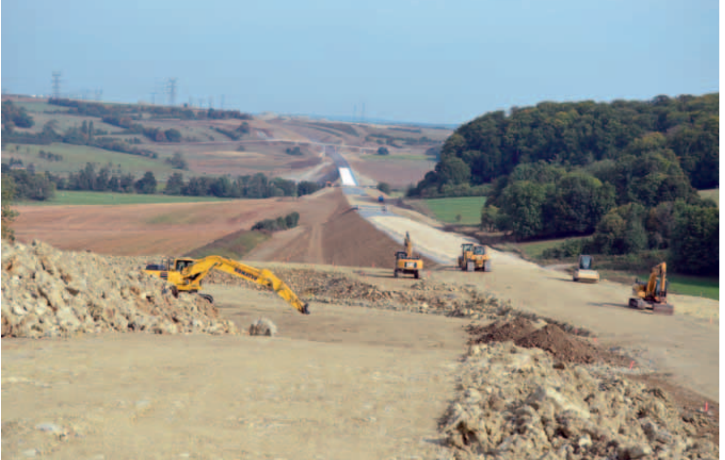
Vue panoramique du chantier de la LGV côte de Dolving avec au fond le Bergholz