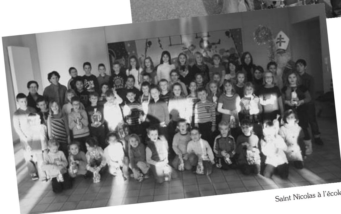
Saint Nicolas à l'école