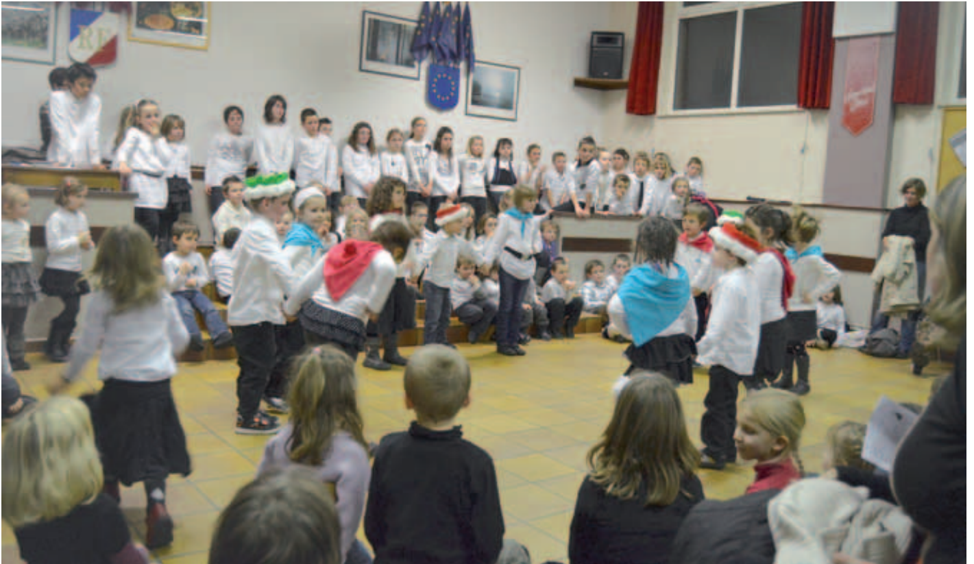
Danse des enfants des écoles lors de leur spectacle de fin d'année pour Noël