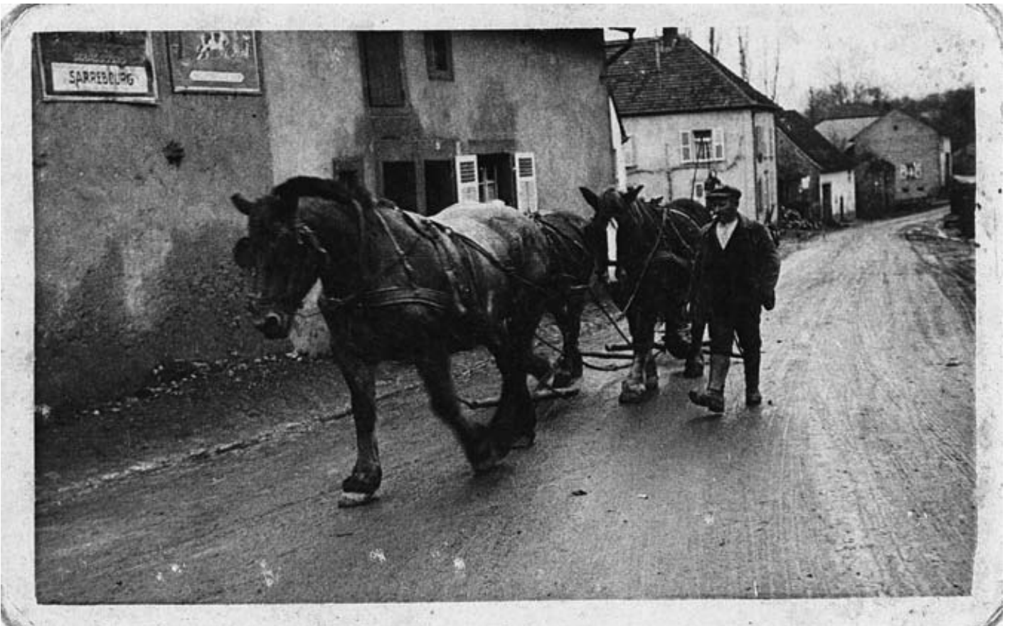
Grosse Auguste traverse la rue de Fénétrange avec ses chevaux vers les années 1950 : aujourd'hui les chevaux vapeurs des puissants tracteurs ont détrôné l'animal. La tractorisation a bouleversé la vie des champs.