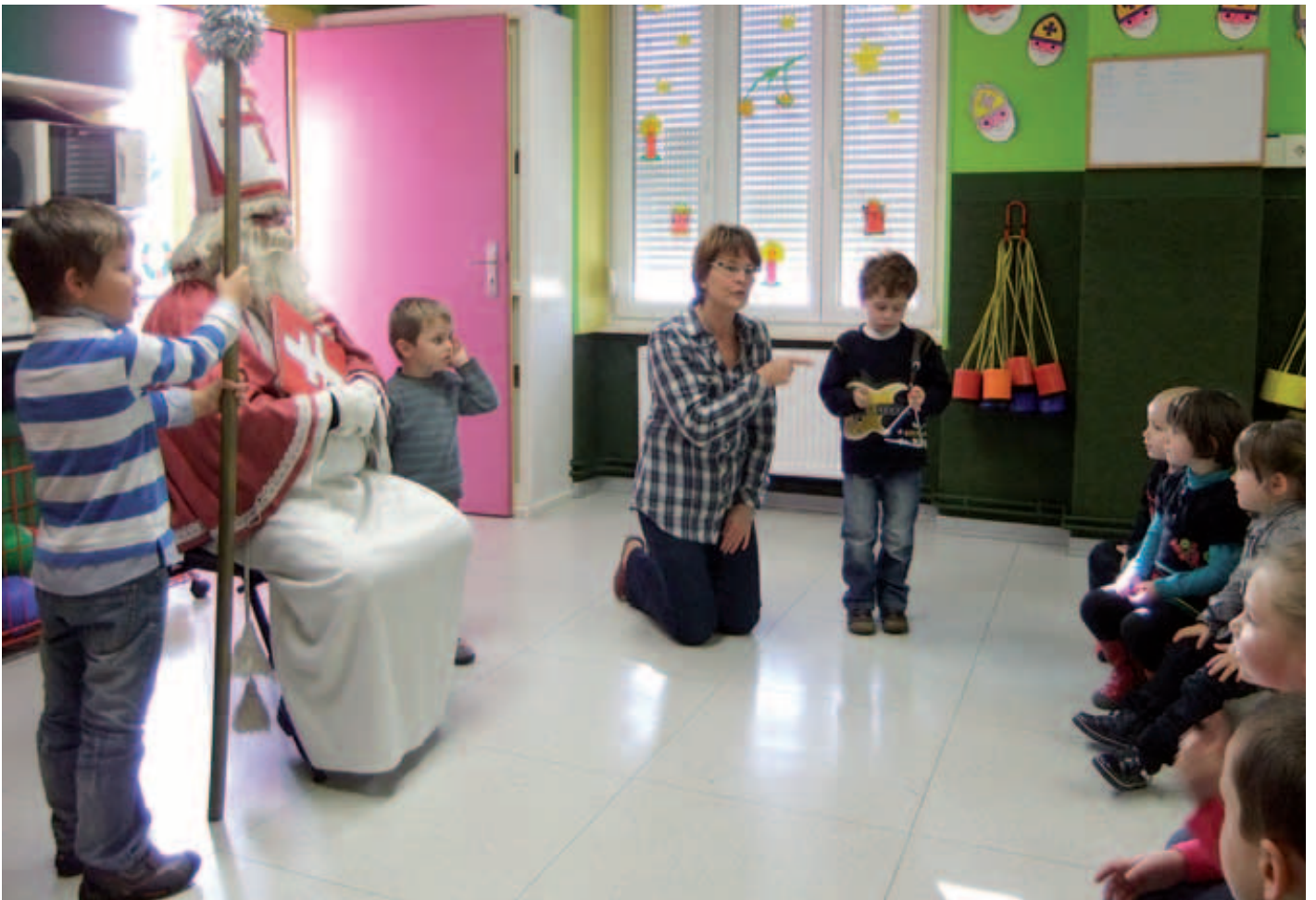
Saint Nicolas, évêque de Myre, patron des écoliers à l'école maternelle