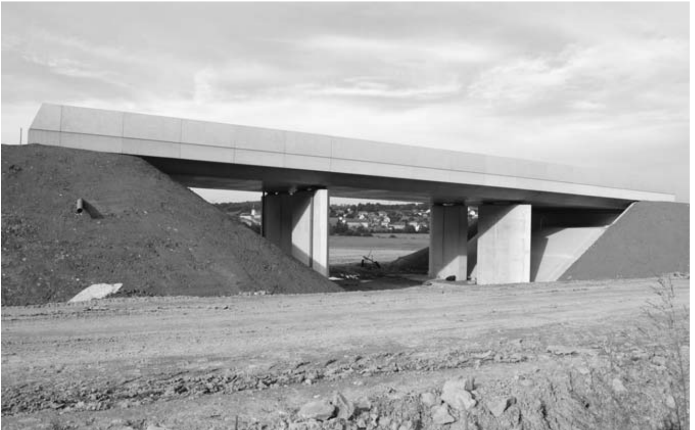
Passage sous la LGV pour la grande faune