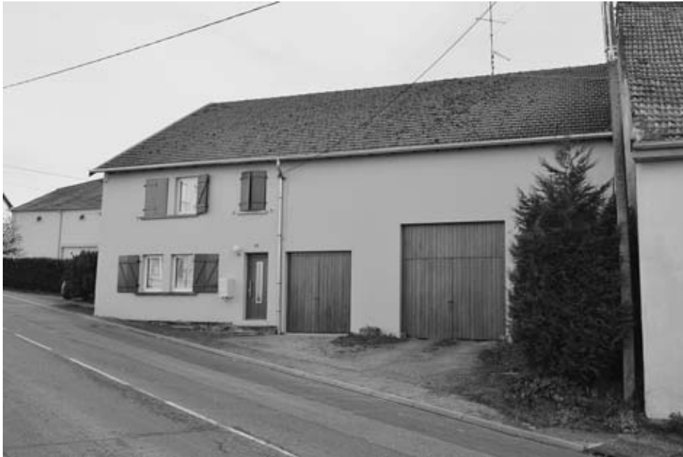
Maison N° 4 rue de Hilbesheim : le prêtre réfractaire s'y cachait dans une niche derrière une armoire lors des perquisitions et y officiait

Le chiffre des déportés par la Convention sous la Terreur (2.6.1793-27.7.1794) se montait à 46 pour les prêtres en Moselle dont 28 sont morts en déportation (1 au cours de son transport) et 48 pour le département de la Meurthe, dont 38 moururent... « pour purger la France du fanatisme re-