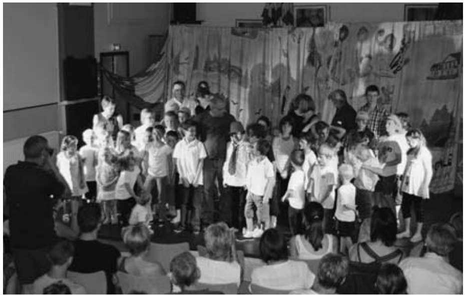
Spectacle final lors du centre aéré

Pour l'Année 2013 l'atelier ouvrira ses portes à partir du 9 janvier.