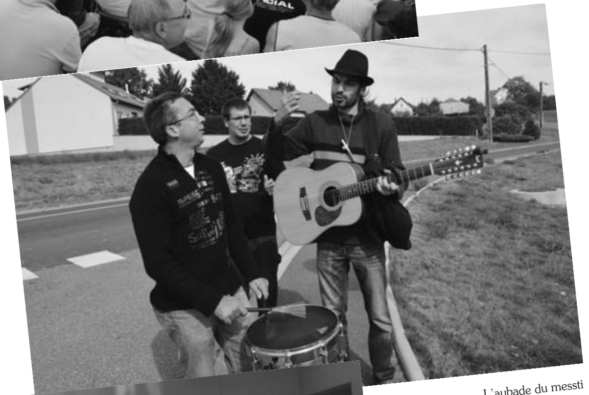
L'aubade du messi