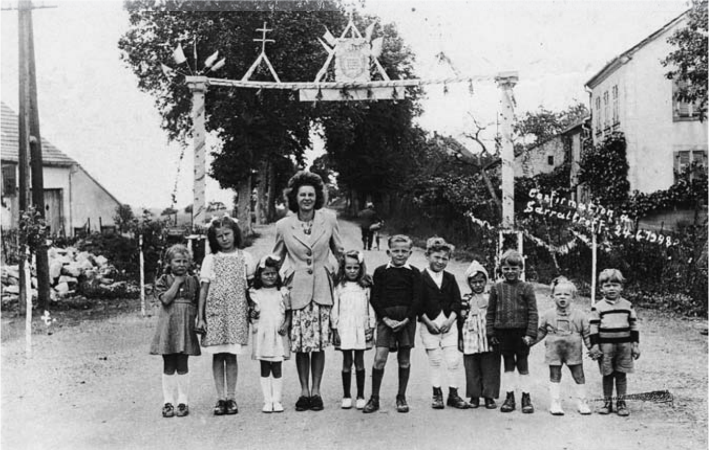
Les fêtes religieuses donnaient lieu à mise en scène avec décoration du village par arcs de triomphe, drapeaux, bannières. Ici la confirmation en 1948. La guerre était juste achevée et les gens manquaient encore de tout, ce qui est visible dans l'habillement des enfants.