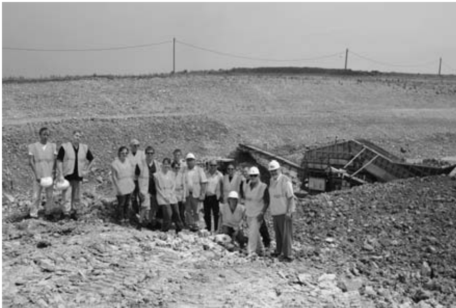
Le conseil municipal pose sur les hauteurs de la LGV vers Dolving devant le sclapeur à disques qui permet de trier les pierres

Enfin je voudrais vous tenir au courant d'un autre projet d'importance bien que sa réalisation ne dépende pas entièrement de nous mais de la communauté de communes de l'agglomération sarrebourgeoise à laquelle nous sommes liés. Je rappellerai simplement aussi que nous resterons membre de la Com Com et qu'il n'y a plus d'inquiétudes à avoir à ce sujet. Ce projet concerne l'épineux problème du raccordement du réseau d'assainissement de Sarraaltroff à la station d'épuration de Sarrebourg située en amont de notre village et qui nécessitera de ce fait la création d'une station de relevage pour refouler les eaux usées vers le haut vers Sarrebourg. J'ai une bonne nouvelle à vous annoncer à ce sujet. Comme vous le savez l'eau est un enjeu du futur. Raison pour laquelle les directives européennes dont la fameuse Directive-cadre sur l'eau (2000 / 60 / CE) font obligation aux états et aux collectivités d'atteindre « le bon état écologique » des milieux aquatiques et du bassin versant. Ces directives prévoient des échéances, des évaluations et des sanctions financières lourdes si ces objectifs ne sont pas atteints d'où l'obligation pour nous de solutionner ces problèmes. Les budgets d'assainissement sont toujours très impressionnants. Si nous étions seuls à en supporter le coût cela se traduirait pour les consommateurs c-