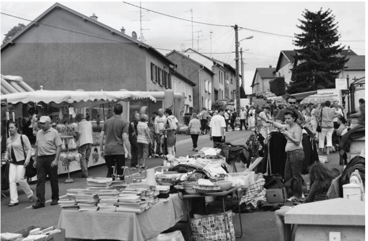
Scène de la foire à la brocante