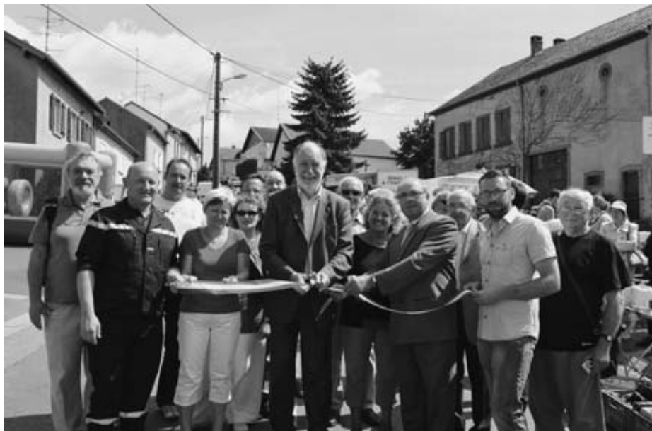
Inauguration de la foire à la brocante

communes. Le réseau intercommunautaire sera pris en charge par la Com Com.