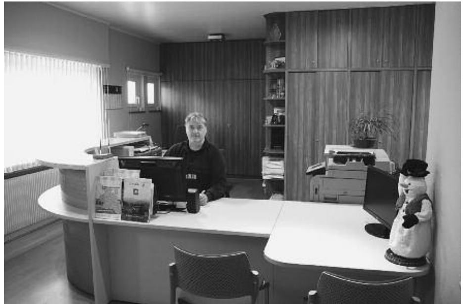
Nouvelle réception à la mairie

tion de lotir en vue de la création d'un nouveau lotissement LES PRUNELLES avec une prévision de 12 places à bâtir.