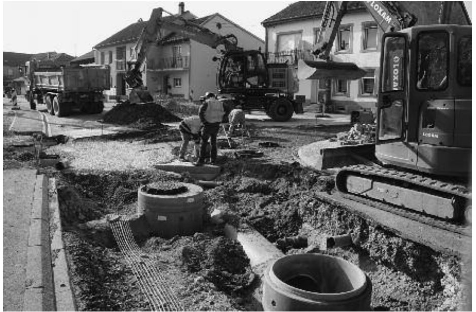
Un aperçu des travaux d'assainissement

Les entreprises SCRE, COLAS et STRUBEL sont chargées de réaliser l'ensemble des travaux sur les réseaux communaux, avec la mise en place de stations de relevage à la Rue de la Sarre, Rue de Sarrebourg, Rue des Faisans.