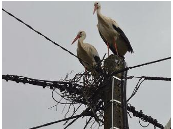
De nouveaux habitants dans la commune : un couple de cigognes qui a donné naissance à deux cigogneaux qui malheureusement n'ont pas survécu.