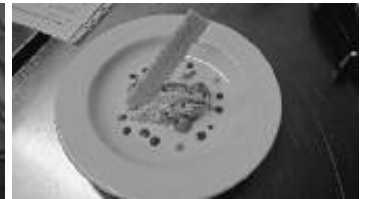
Ballotins de poulet Contois, risotto au lentilles et tuiles de comté AOP

Centre aéré du mois d'août au city stade - hand-ball