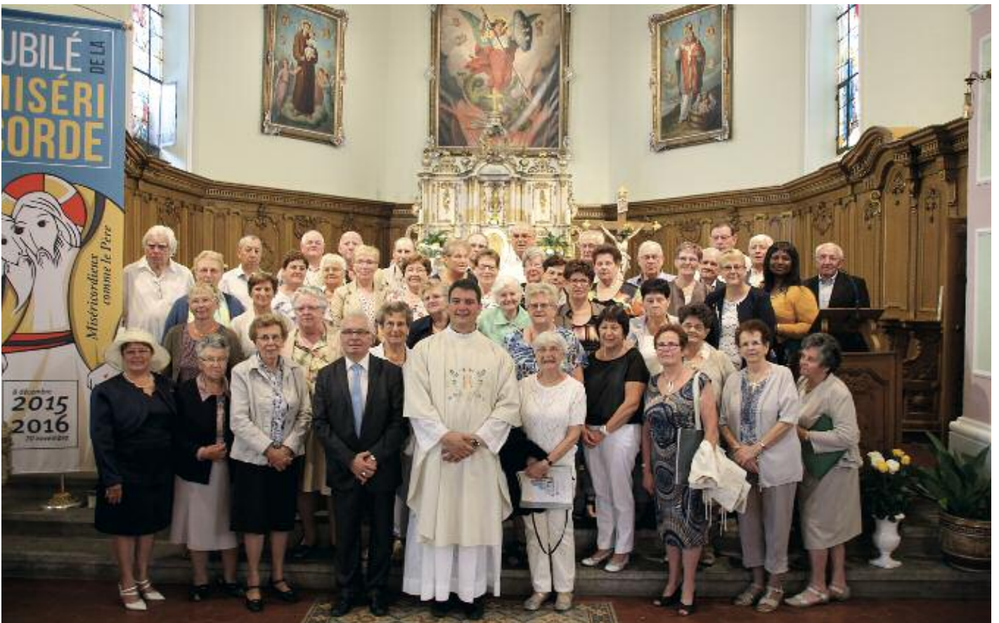
Avec les chorales inter-paroissiales