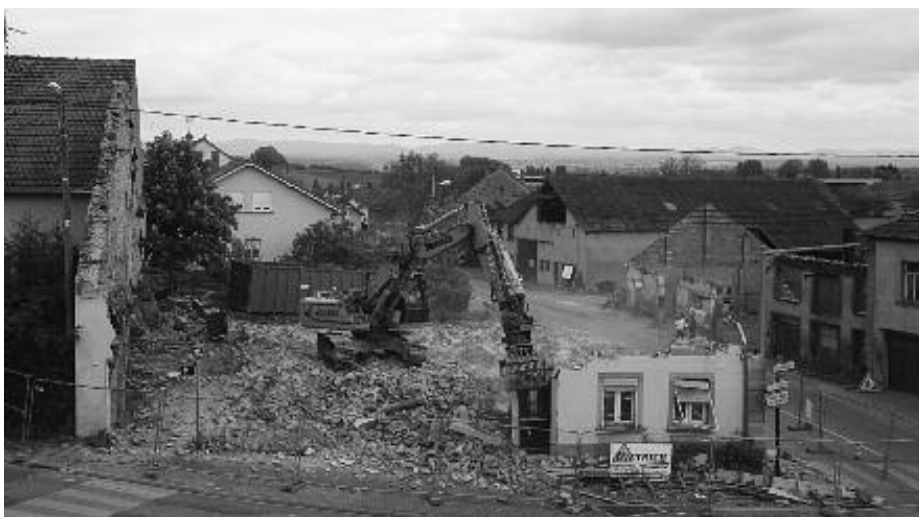
La démolition du café Grosse