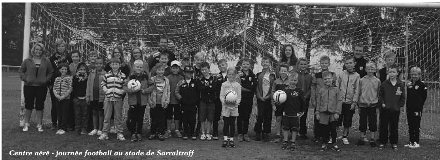
Centre aéré - journée football au stade de Sarraltroff