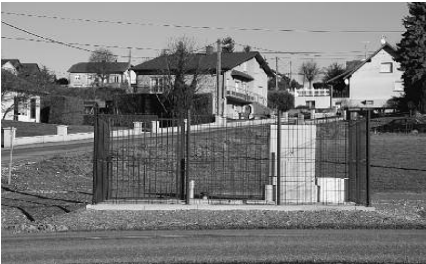
Poste de relevage route de Fénétrange