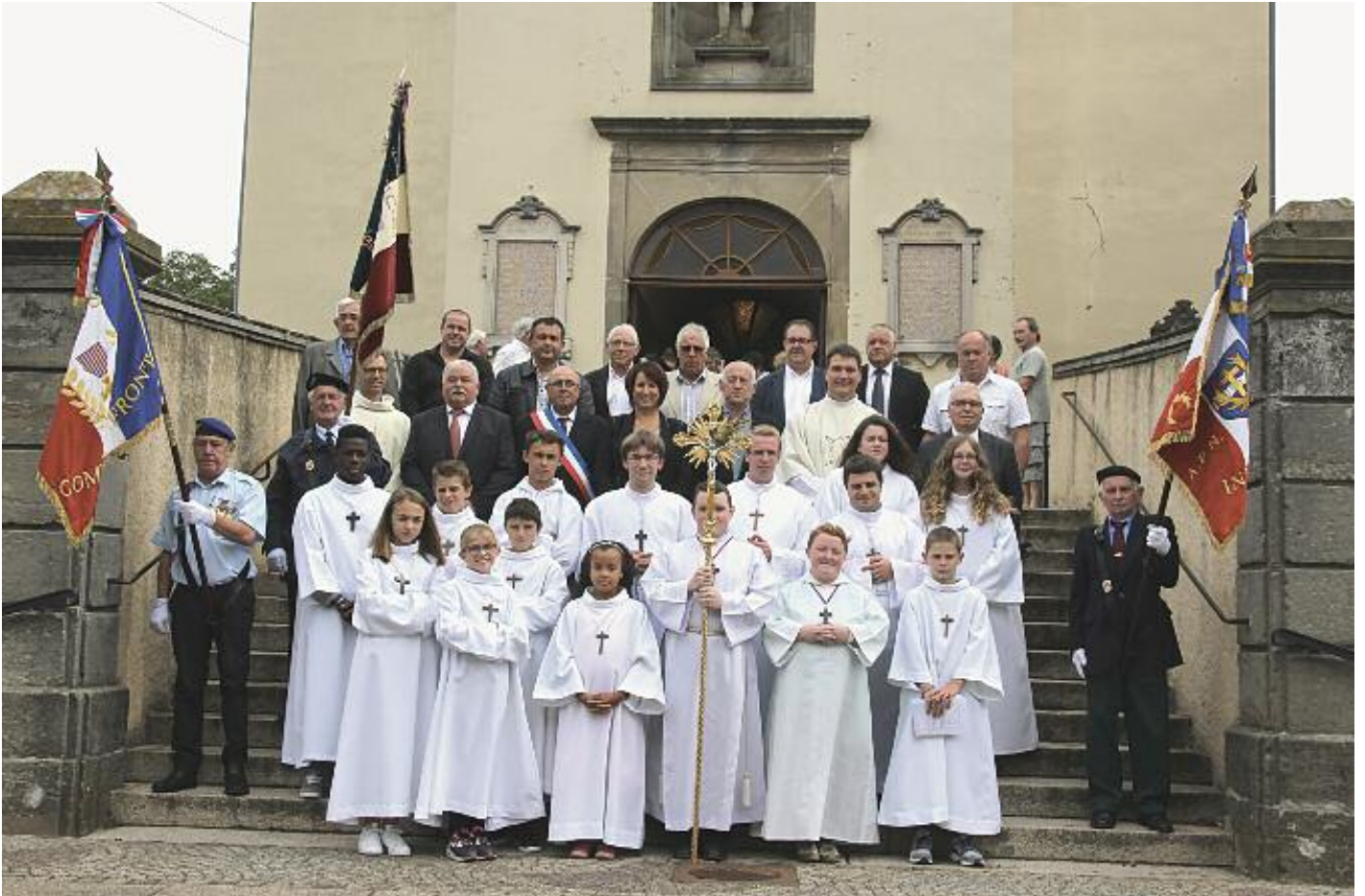
Avec les servants de messe et les personnalités