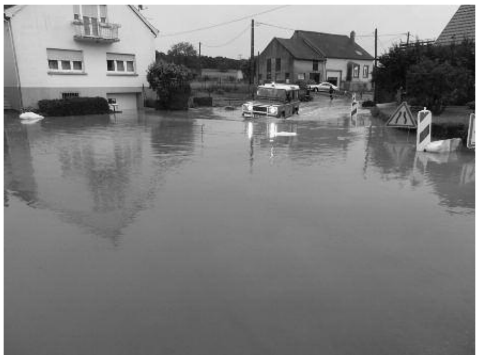
Inondations du 25 juin 2016

Les Sapeurs Pompiers, la Présidente et les Membres de l'Amicale vous présentent leurs meilleurs vœux de santé, bonheur et prospérité pour 2017