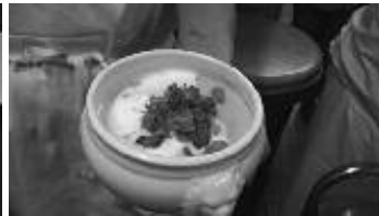
Crème Dubarry à la brunoise de noix de St Jacques