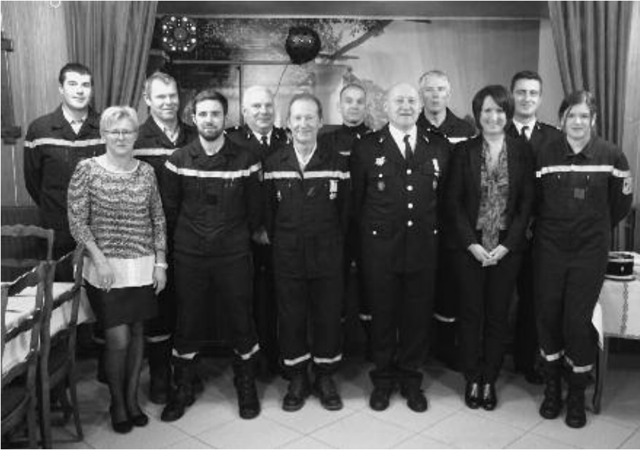
Fête de la Saint Barbe au Lion d'Or

Le bilan de l'année 2016 sera à marquer d'une pierre noire pour l'Amicale des Sapeurs Pompiers.