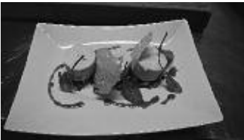
Bonbons de foie gras à la mangue, tartare d'avocats, crevettes et grenades. Sauce d'agrumes