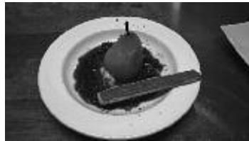
Poires pochées au vin rouge de Bourgogne épicé et au cassis, granité au Côtes de Beaune