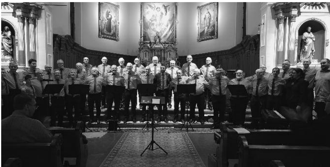
Le chœur d'hommes « Les Joyeux Compagnons »