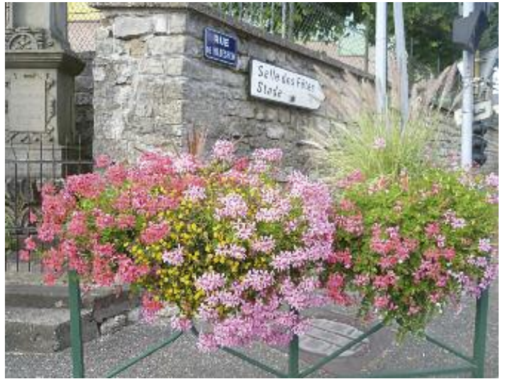
Les compositions florales de l'été