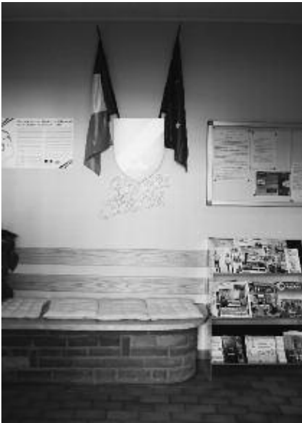
Aménagement de l'entrée de la mairie

mairie et de l'entrée avec un accès handicapé,