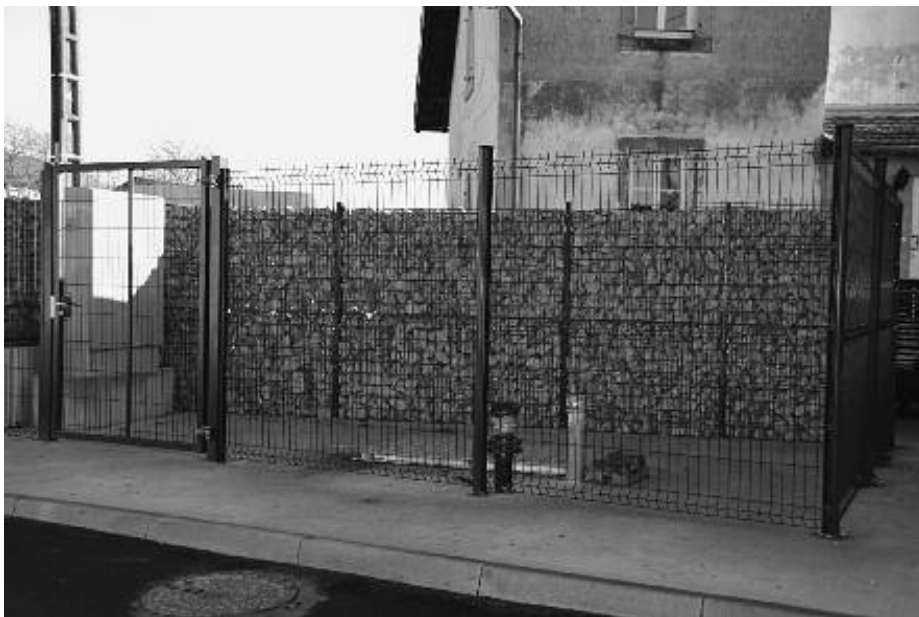
Travaux d'assainissement : Poste de relevage rue de la Sarre