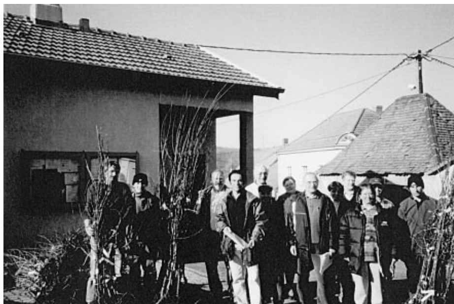
Après la tempête de 1999, le Conseil Général a livré des scions pour reconstituer les vergers

Des doutes planent sur la fameuse bouillie bordelaise réputée peu toxique et seule admise en agriculture biologique, elle est interdite en Allemagne.