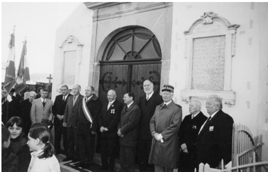
Inauguration des deux stèles érigées pour les morts de Sarraltroff 1914-1918

par an servent à réaliser et conserver la mémoire de celle et de ceux qui sont morts pour la Patrie.