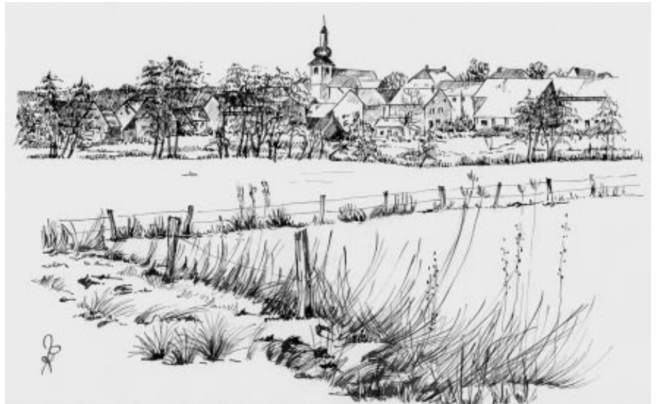
Neige à Sarraltroff.

Vue du village à partir du chemin sur la rive gauche de la Sarre de Hoff à Sarraltroff (Dessin de Marie-Paule Kugler)