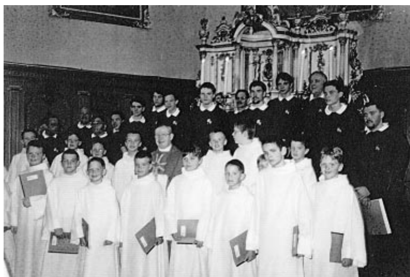
Pentecôte. Messe du festival des Chemins du Baroque : les Petits Chanteurs de Saverne à Sarraltroff

La chorale Saint Michel est un noyau de quelques rares voix de basses et de ténors et autour d'eux quelques voix d'altos et de sopranos. Avec un effectif aussi mince, tout peut se trouver compromis par un ou deux départs. Je lance donc un appel à tous ceux qui partagent la passion du chant, et les invite à nous rejoindre.