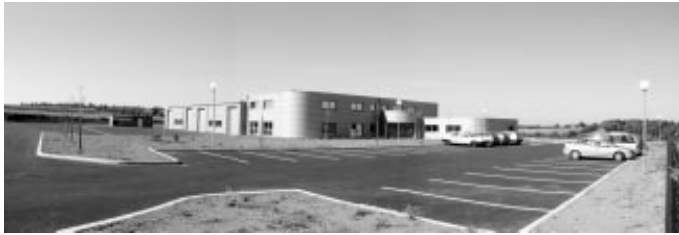
Le bâtiment de la Communauté de Communes.

communes de l'arrondissement, assuré au centre de stockage de HESSE, la gestion mutualisée du réseau des 6 déchetteries, la constitution d'un groupement de commandes pour le renouvellement des marchés de collecte ou de tri des déchets de l'ensemble des structures intercommunales ou encore l'entretien des berges de la SARRE sur tout son parcours en MOSELLE sud. Jour après jour, notre Communauté de Communes investit, construit et imagine sans cesse une politique pour le Pays de SARREBOURG.