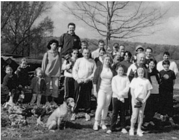
Plus de 260 marcheurs ont participé à la sortie printanière organisée par l'association de gymnastique volontaire.