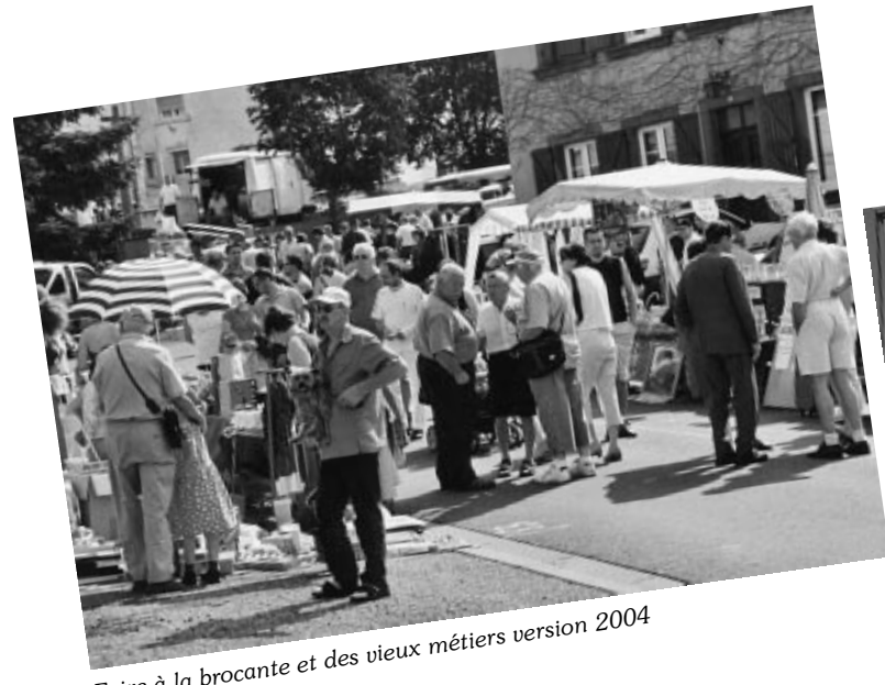
Foire à la brocante et des vieux métiers version 2004