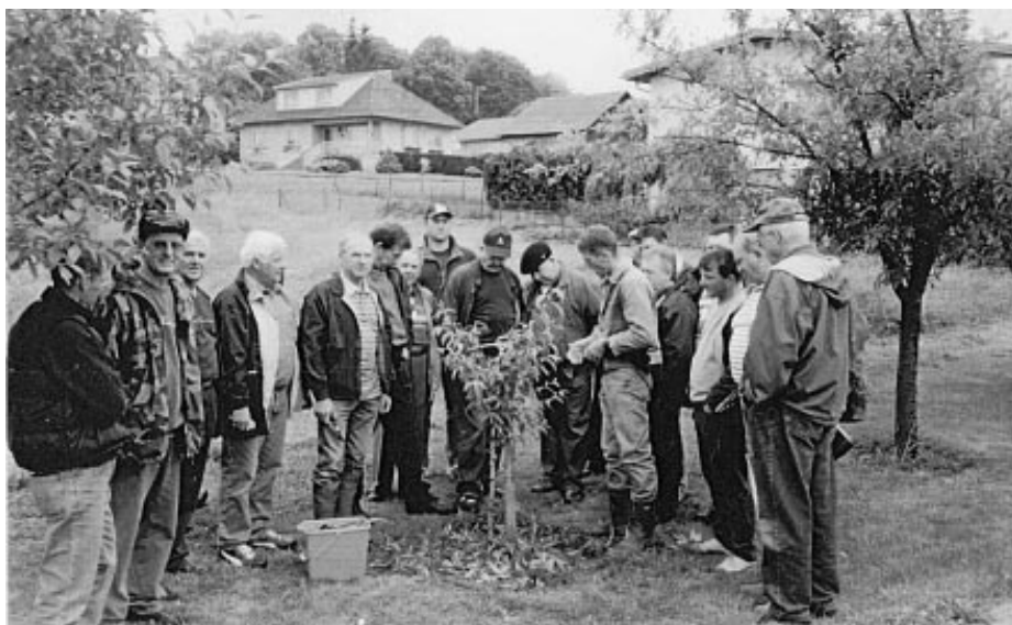
Les arboriculteurs se sont familiarisés avec les greffes et la taille de jeunes arbres

Savoir traiter, identifier les maladies, fait également partie de tout le savoir que se doit de posséder tout arboriculteur. La Société d'Arboriculture est là pour conseiller, pour dispenser savoir et savoir faire. Les formations sont un support utile pour tout ceux qui souhaitent en savoir plus.