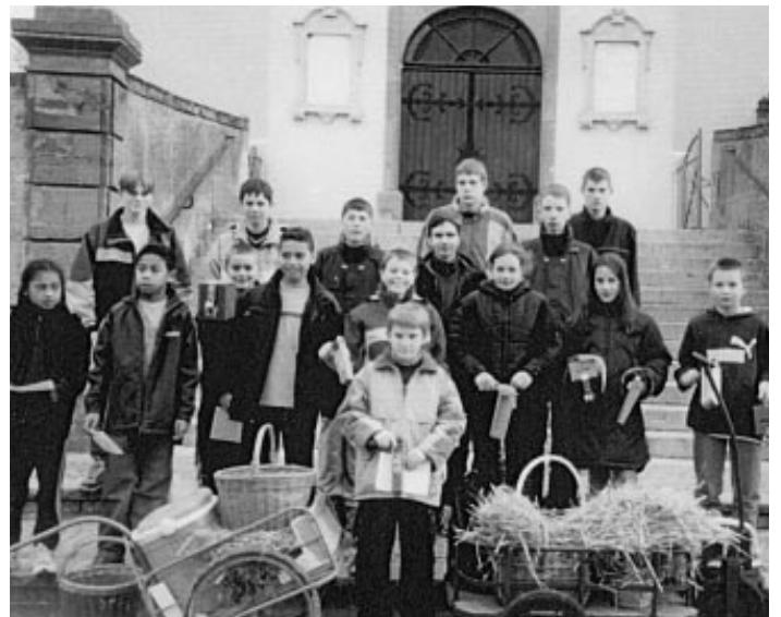
Pâques : La tournée des crécelleurs