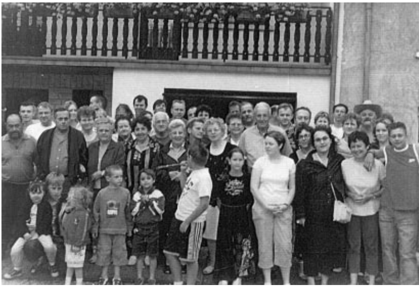
La rue de la Fontaine en fête : soixante-quinze personnes du quartier se sont réunies pour une journée à reconduire en 2005