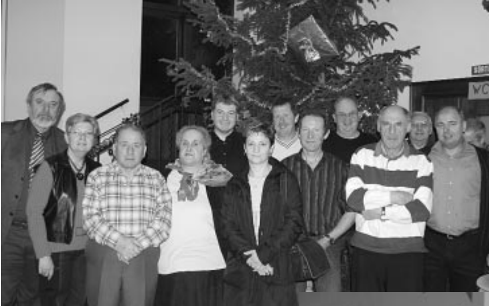
Fête de Noël du personnel communal