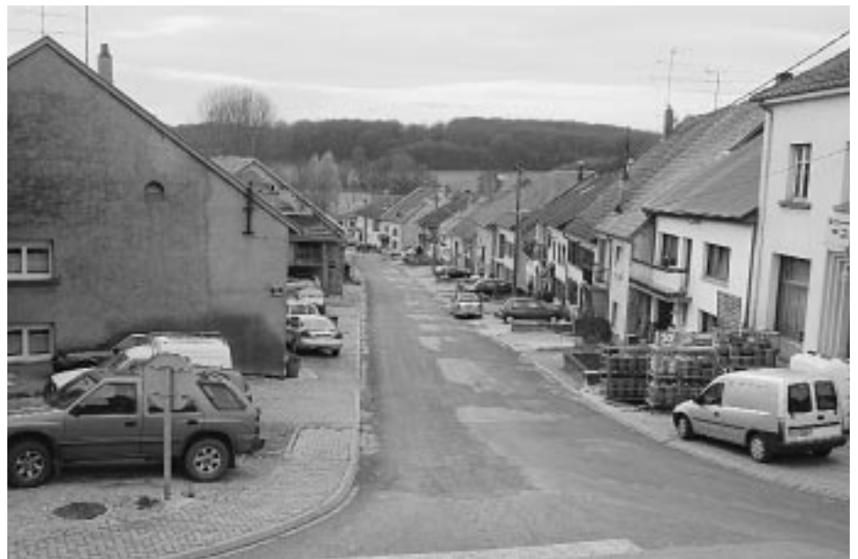
Travaux réalisés rue de la Fontaine

Puisque nous parlons des problèmes d'eau, j'en viens à celui qui a semé comme une tempête chez certains dans le village, à savoir l'assainissement. Notre propos n'est pas de polémiquer, mais il faut admettre que les esprits se sont échauffés à tort, même s'il l'on peut nous reprocher un certain manque d'information. En fait, c'est le collecteur d'orage ou plutôt sa localisation qui a posé problème. Nous avons, devant cette levée de boucliers, demandé au Cabinet d'Etudes BEREST (étude financée par la Communauté de Communes de l'Agglomération de Sarrebourg) de