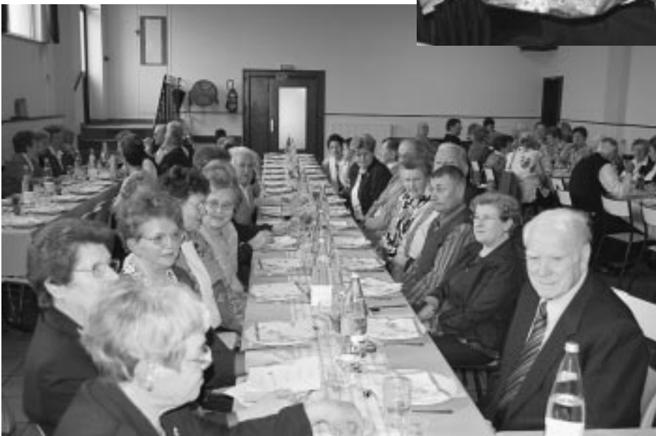
Les aînés, hôtes de la municipalité