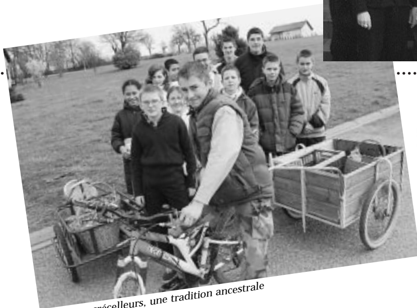
Les crécelleurs, une tradition ancestrale