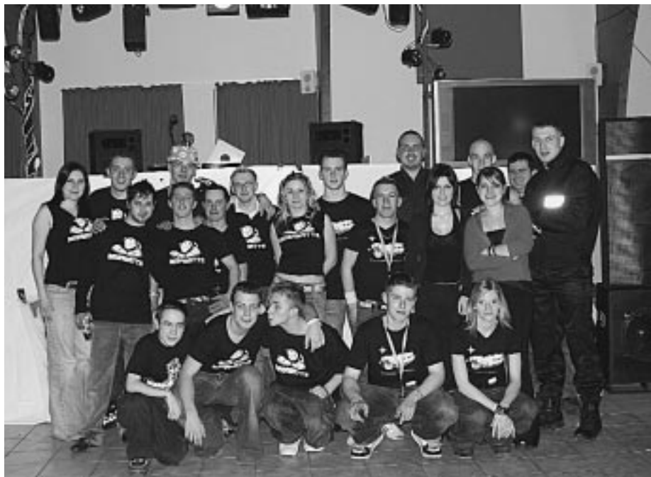
Soirée " Capitaine de soirée " 18 février 2006