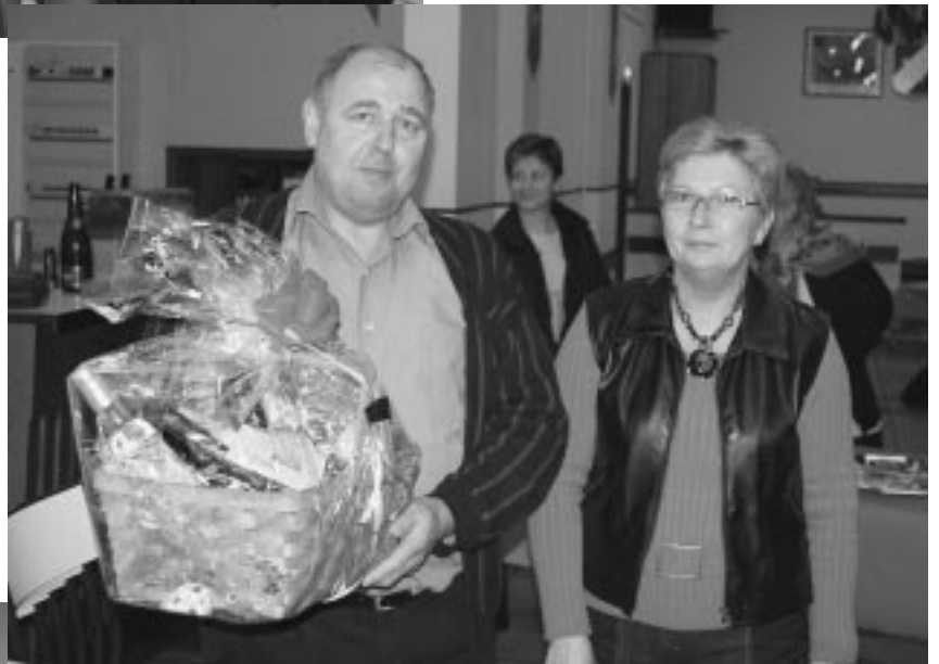
Une attention toute particulière pour M. le maire...