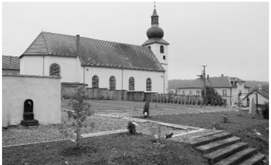
Extension du cimetière

pour finir au cimetière. Celui de Sarraltroff s'avérant exigu, il a été étendu sur l'aire de l'ancienne ferme Hiegel acquise en 1996. Une communication avec l'ancien cimetière a été aménagée, les allées sont prêtes, un ossuaire, un jardin du souvenir et une allée du souvenir ont été mis en