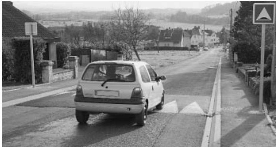
Ralentisseur rue des Vergers

Enfin, j'en viens à un autre problème préoccupant. Nous avons déjà évoqué le problème de la baisse de la natalité et ses répercussions possibles sur le fonctionnement de nos écoles : 6 naissances en 2005 et à ce jour 5 naissances en 2006 ne suffiront pas à pérenniser le fonc-