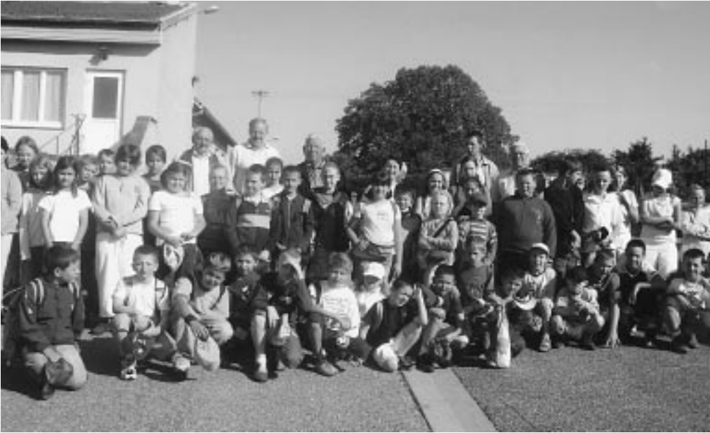
Sortie scolaire à Schirmeck-Struthof

Le Souvenir Français de Sarraltroff compte actuellement 78 membres. Au flambeau de la mémoire, le comité ne manque jamais de rappeler aux différentes générations de conserver la faculté de se souvenir de ceux qui sont morts pour la patrie et de transmettre le devoir de mémoire.