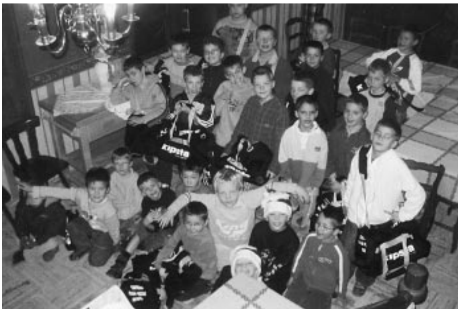
Fête de Noël

Après une saison passée en deuxième division, nous tenons à