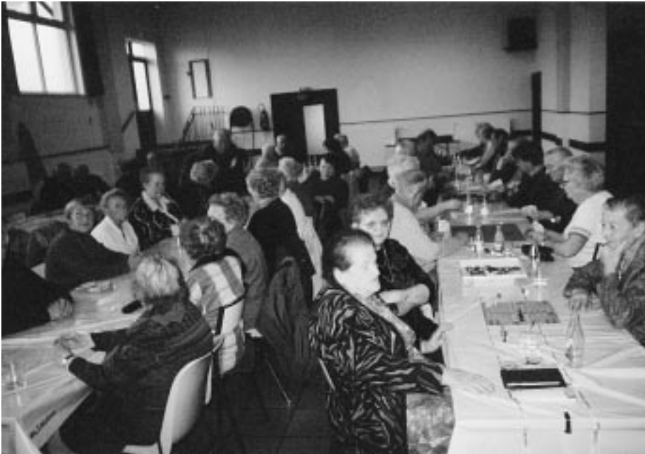
Rencontre à la Salle des Fêtes

Pour terminer, je me joins au comité pour vous souhaiter une bonne et heureuse ANNEE 2007