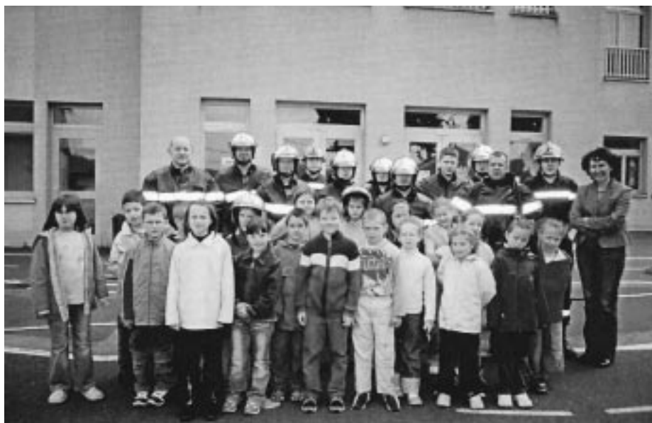
L'école en feu : thème de la manœuvre des sapeurs-pompiers

Tous le corps des Sapeurs-Pompiers, le président et les membres de l'amicale vous présentent leurs meilleurs vœux pour l'année 2007.