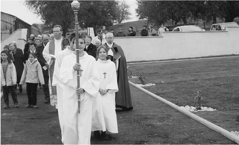
Bénédictio du nouveau cimetière le 5 novembre 2006