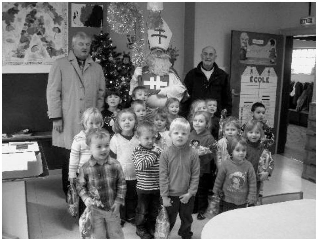
Saint Nicolas à l'école