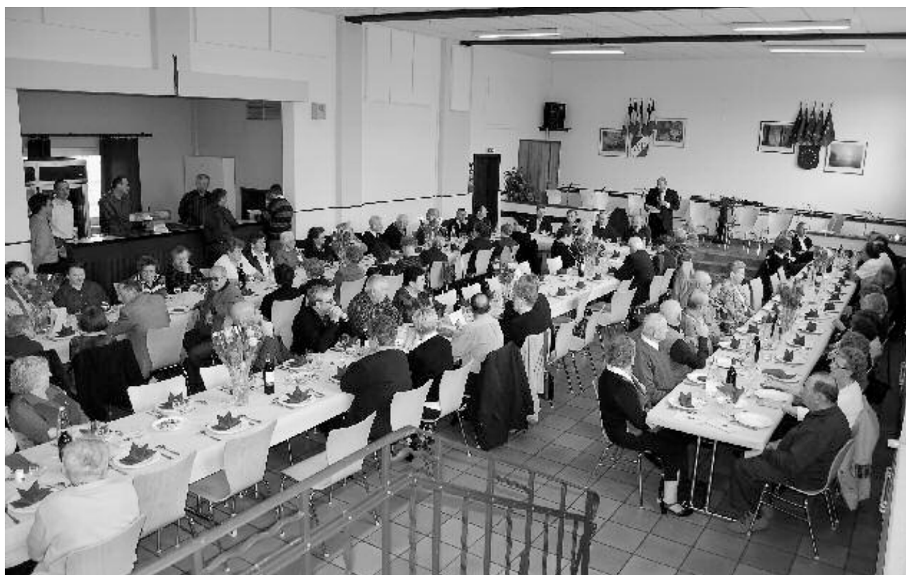
Le repas des aînés