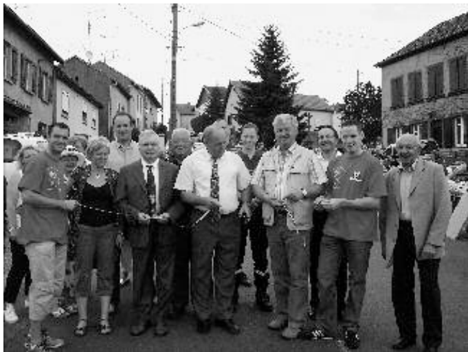
Ouverture officielle de la foire à la brocante

La saison 2007-2008 a été marquée par la descente de l'équipe A en deuxième division. Malgré ce petit retour en arrière, l'équipe a su rebondir et se classer en haut du tableau. Quant à l'équipe B, elle est actuellement jumelée avec Dolving et Langatte. A ce jour, il n'y a malheureusement plus d'équipe de jeunes. Pour l'année 2009, nous espérons pouvoir à nouveau constituer une équipe de débutants et de poussins. Dans cette optique, nous lançons un appel à tous les jeunes qui souhaiteraient intégrer le club. Pour toute inscription, n'hésitez pas à nous contacter au 06.33.98.00.09.