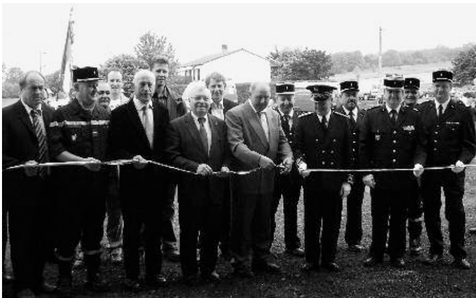
Inauguration du nouveau local sapeurs-pompiers

Le Corps des Sapeurs-pompiers, la Présidente et les membres de l'Amicale vous présentent leurs meilleurs vœux pour l'année 2009.