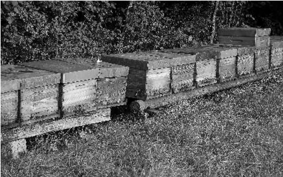
Photo : ruches au Romansberg à Sarraltroff