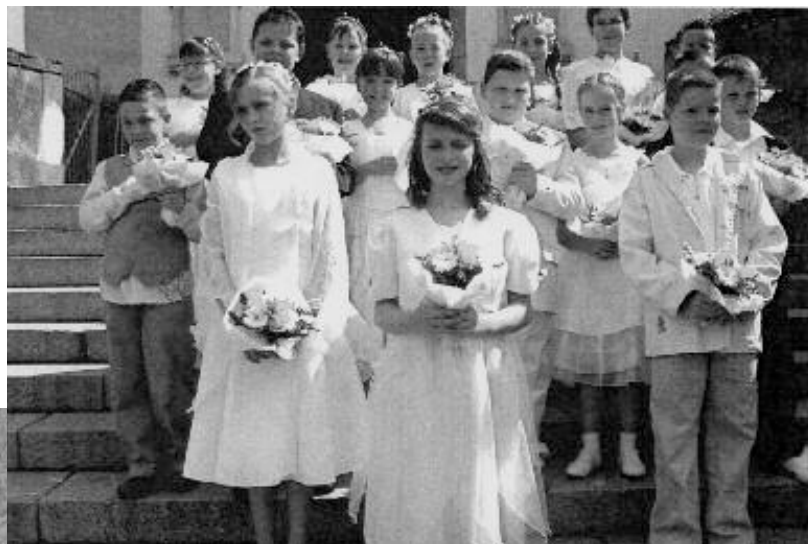
Les communiantes à Sarraltroff