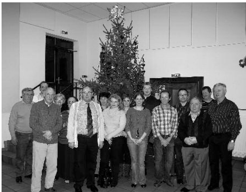
Fête de Noël du personnel communal