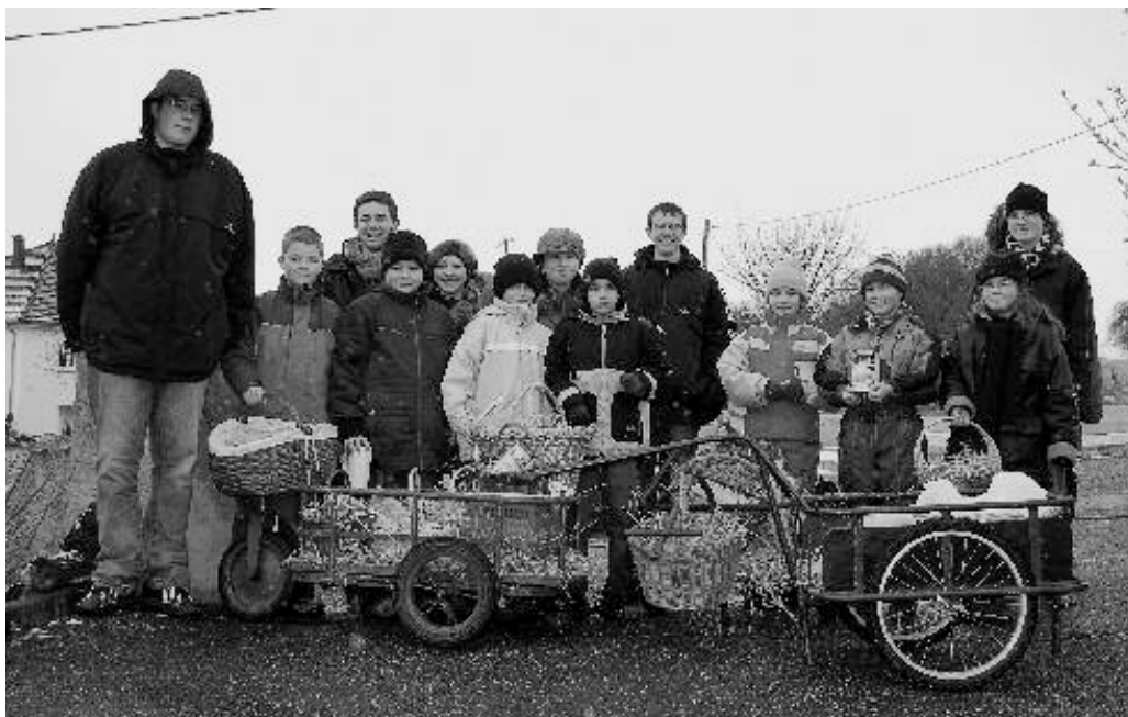
Pâques. Les œufs et la neige...