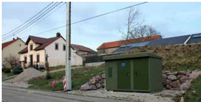
Photo nouveau poste transfo

par l'Etat au titre du Fonds Vert. Ces travaux se font attendre, promis avant Noël par l'entreprise en charge des travaux, ils ne seront réalisés qu'au début de l'année 2024.