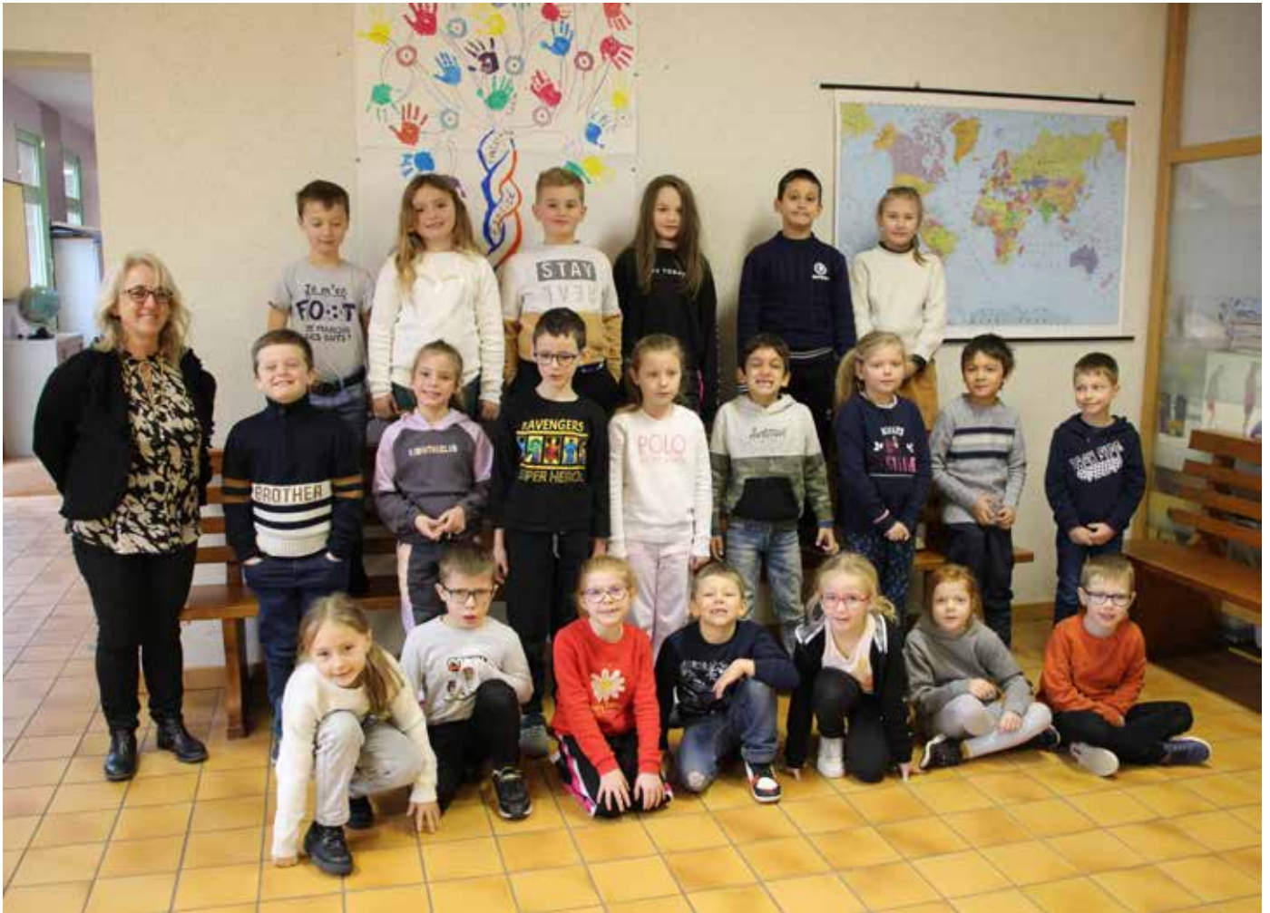
Saint Nicolas à l'école primaire.