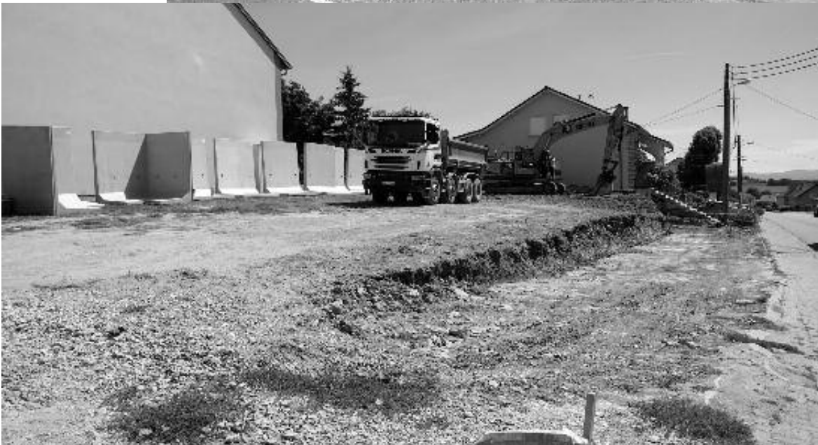
Travaux du parking centre, sur l'ancien emplacement du café Grosse