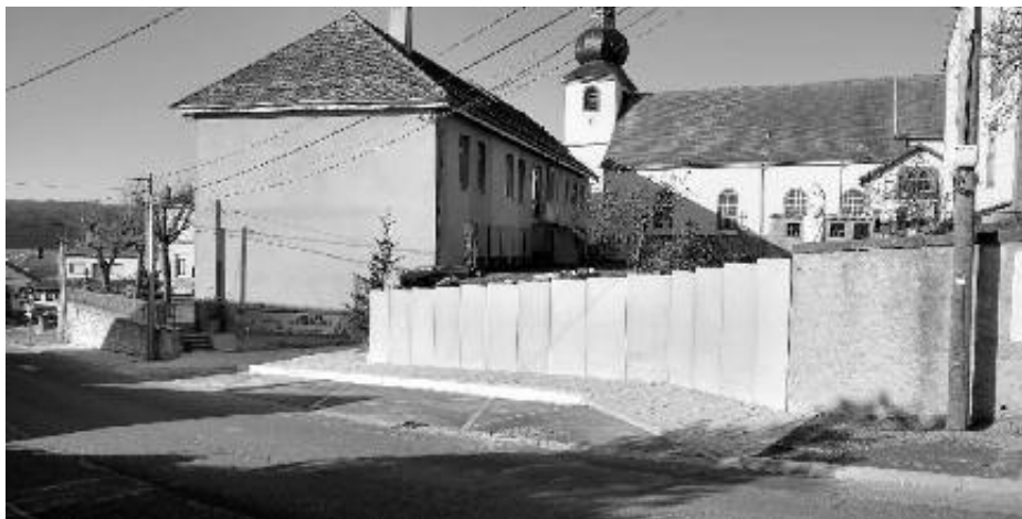
Réalisation d'un arrêt de bus pour le périscolaire

Dans le Lotissement des Prunelles, la commercialisation des parcelles a démarré au début de l'année 2020, à ce jour, 3 constructions sont en cours, six parcelles sont vendues et 6 autres restent disponibles à la vente au prix de 4200 € l'are. Le secrétaire de mairie se tient à votre disposition pour vous apporter tout renseignement concernant la réservation et l'acquisition d'un terrain.