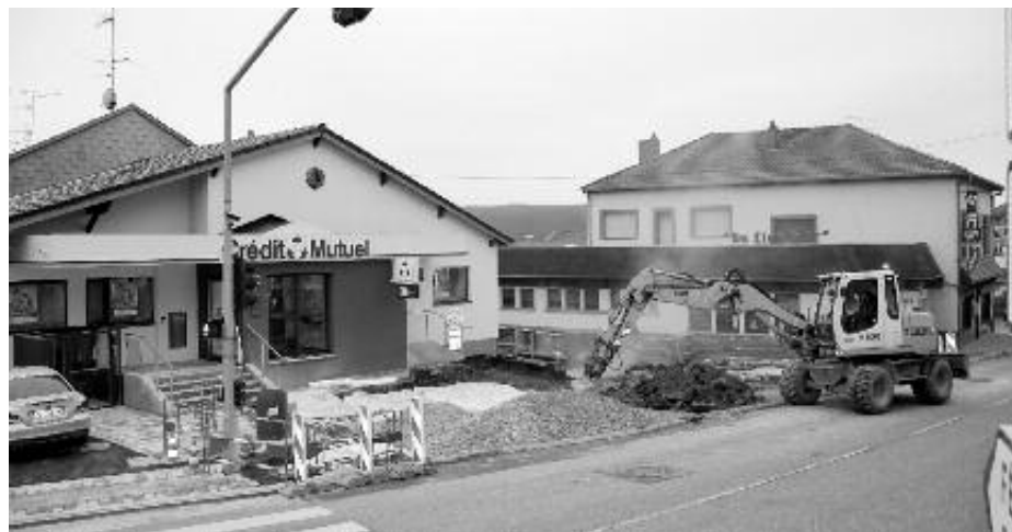
Travaux du parking devant le Crédit Mutuel

voux en charge de la Communauté de Communes CCSMS) et au début du mois de février 2021, dans cette même rue, le réseau d'eau potable sera remplacé par le Syndicat des Eaux de Win-