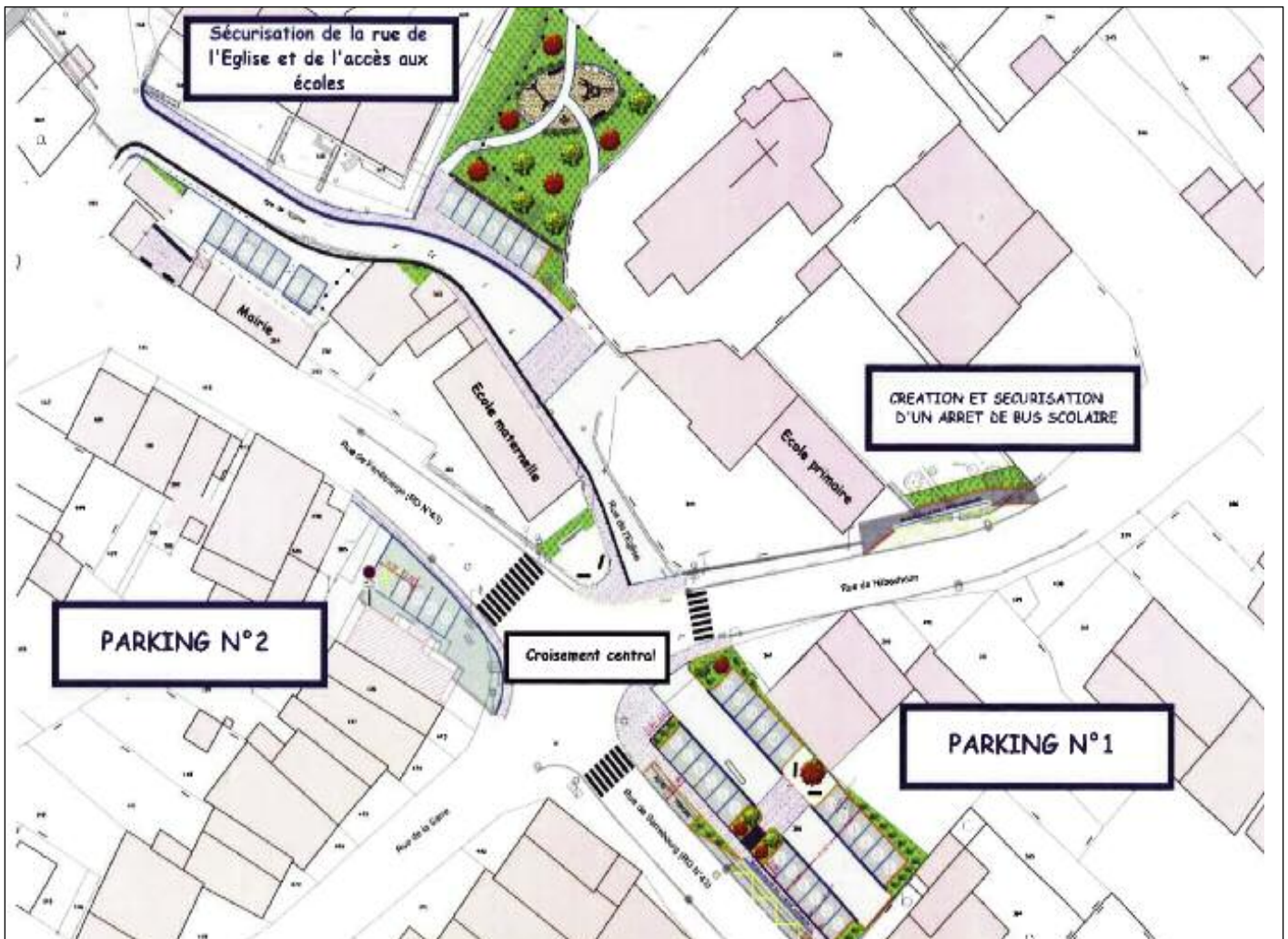
Plan global du centre du village