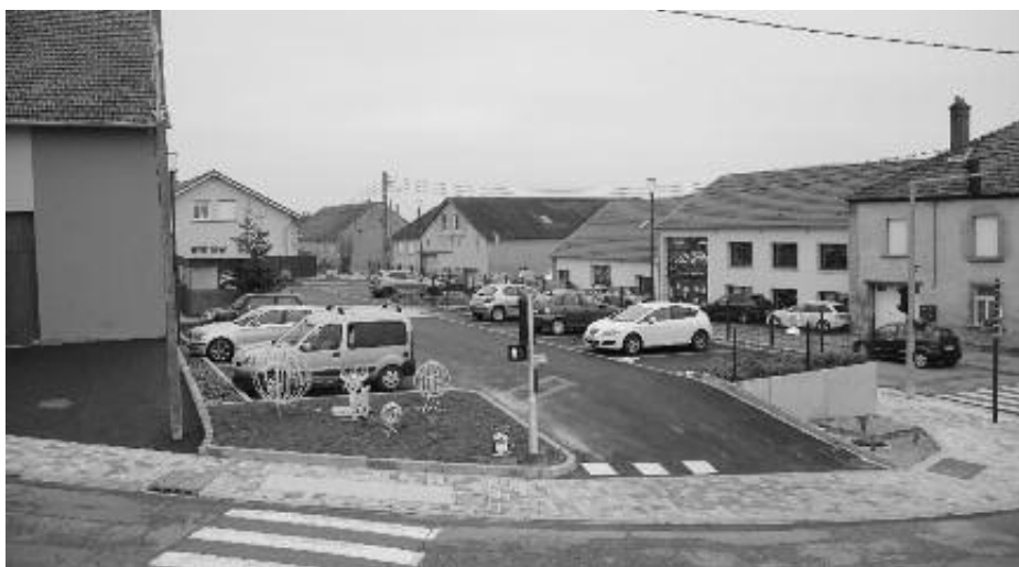
Parking au centre du village

2021 verra également l'activation et l'arrivée de la Fibre Optique sur notre village. Depuis plusieurs mois déjà, le Département de la Moselle réalise la jonction de chaque résidence à son réseau de fibre optique départemental. La commune de Sarraltroff est rattachée à la "Plaque de Bettborn" qui est mise en service en janvier 2021. Concrètement, ce nouveau service permettra de surfer via le très haut débit que propose la fibre. Les connexions chez les particuliers sont gratuites. En début d'année 2021 Orange proposera ce service. Puis, quelques mois plus tard, les autres opérateurs proposeront des forfaits fibres aux particuliers. Vous pouvez d'ores et déjà vous adresser à votre fournisseur d'accès.