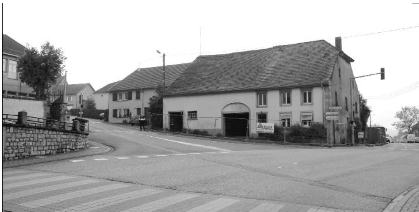
Café Grosse, actuellement transformé en parking après démolition de celui-ci