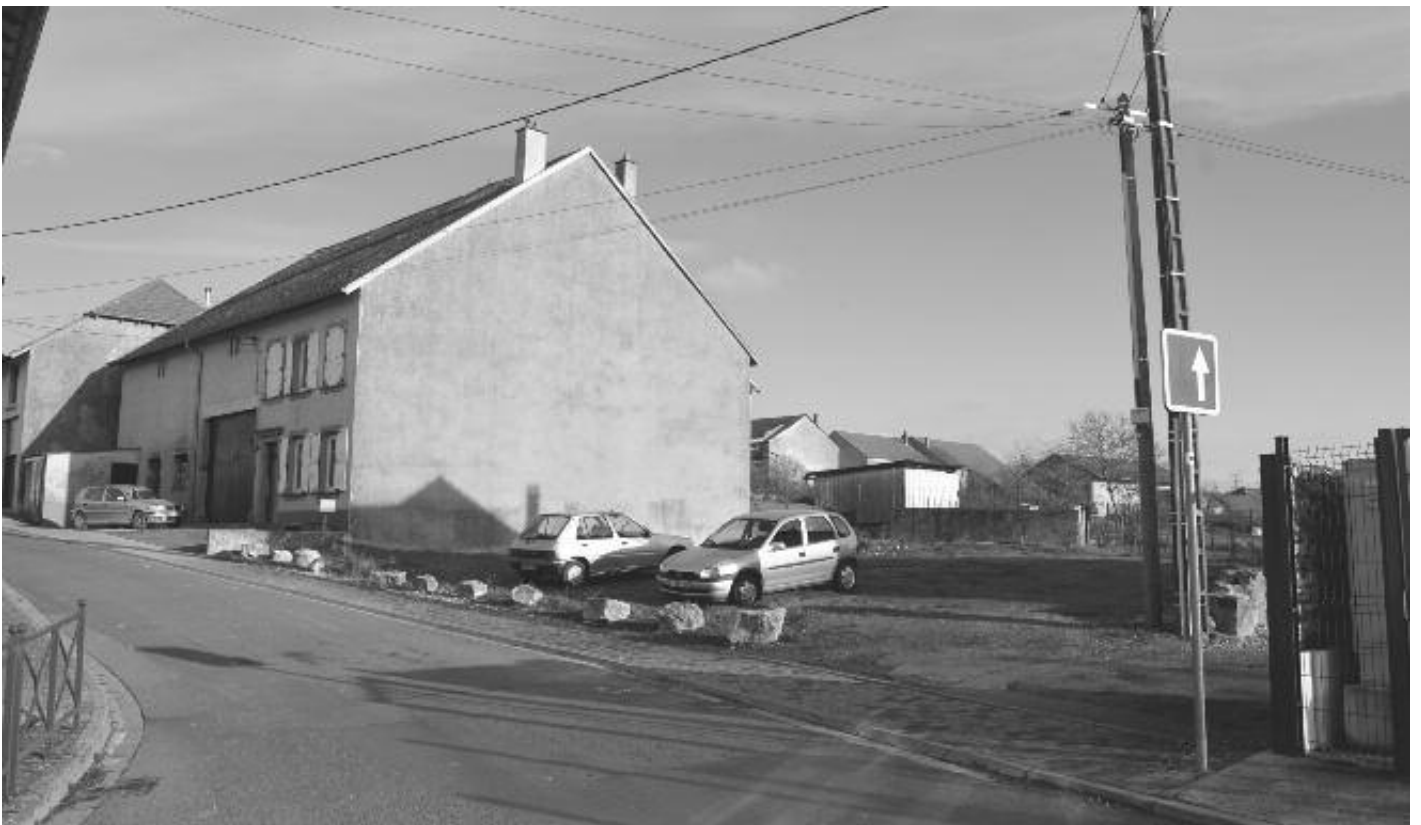
Aspect actuel laissé vide

Pendant la guerre, la cave voûtée de cette maison détruite avait servi d'abri pour les habitants du quartier qui y avaient installé des lits de fortune. En effet, de nombreux avions alliés survolaient la voie ferrée proche pour mitrailler les convois allemands et les alertes furent nombreuses comme lors de la fameuse attaque d'un convoi de chars allemands en 1944 ayant fait de nombreux morts parmi les soldats.