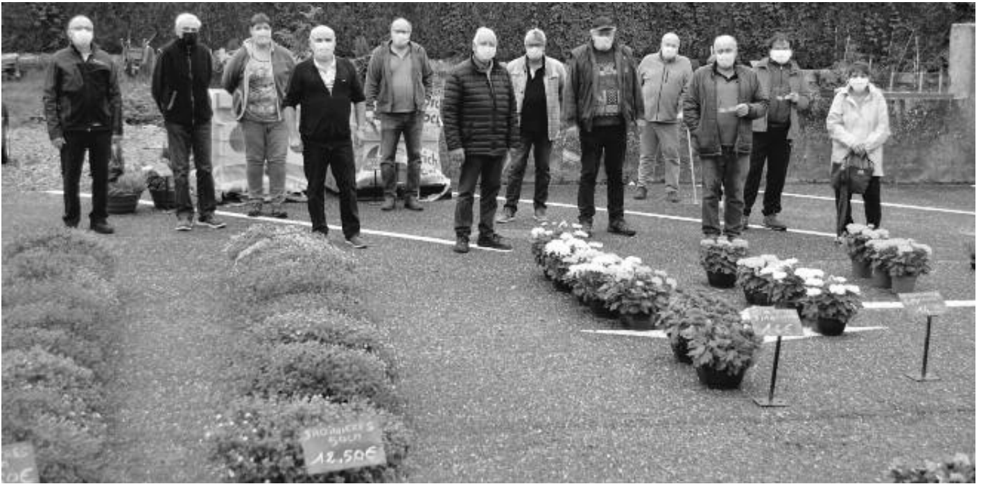
La vente de chrysanthèmes au profit du CAT à l'approche de la Toussaint a pu se tenir en respectant les mesures sanitaires en vigueur

Nous venons de vivre une année singulière marquée par la pandémie du coronavirus qui nous a plongés dans une crise sanitaire, sociale et économique qui risque de se prolonger. Revenons sur cette année 2020.