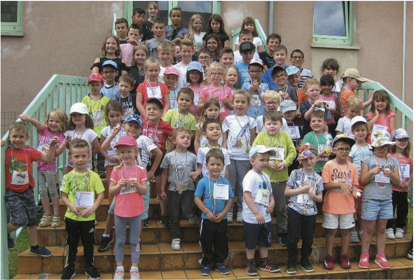
Les enfants se sont bien divertis grâce aux activités sportives organisées par l'usep (union sportive de l'enseignement du premier degré)