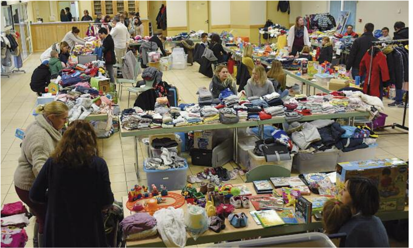
La bourse aux vêtements de l'association des parents d'élèves du RPI de Sarraltroff a été organisée à la salle des fêtes d'Oberstinzel