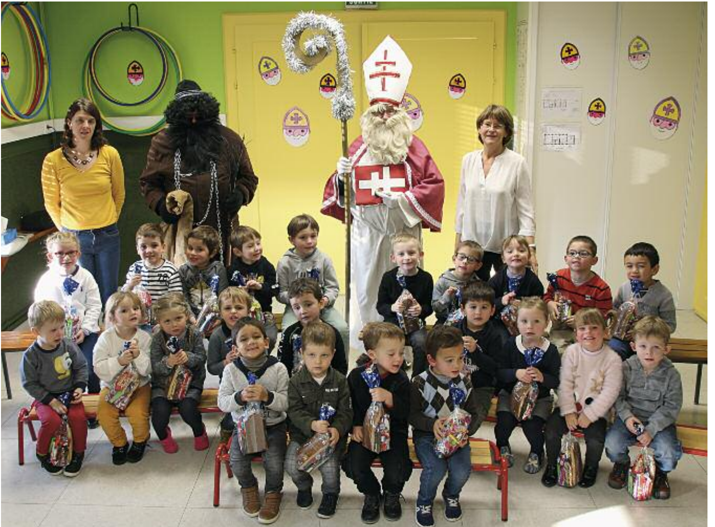
Visite de Saint Nicolas à l'école maternelle