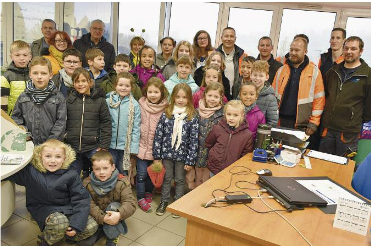
Circuit pédagogique à travers la station d'épuration ; les enfants découvrent toutes les étapes du traitement des eaux usées