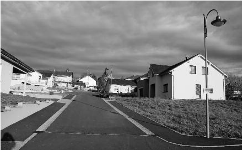
Lotissement des Perdrix (Impasse de la Chapelle) : voirie définitive et pose des enrobés