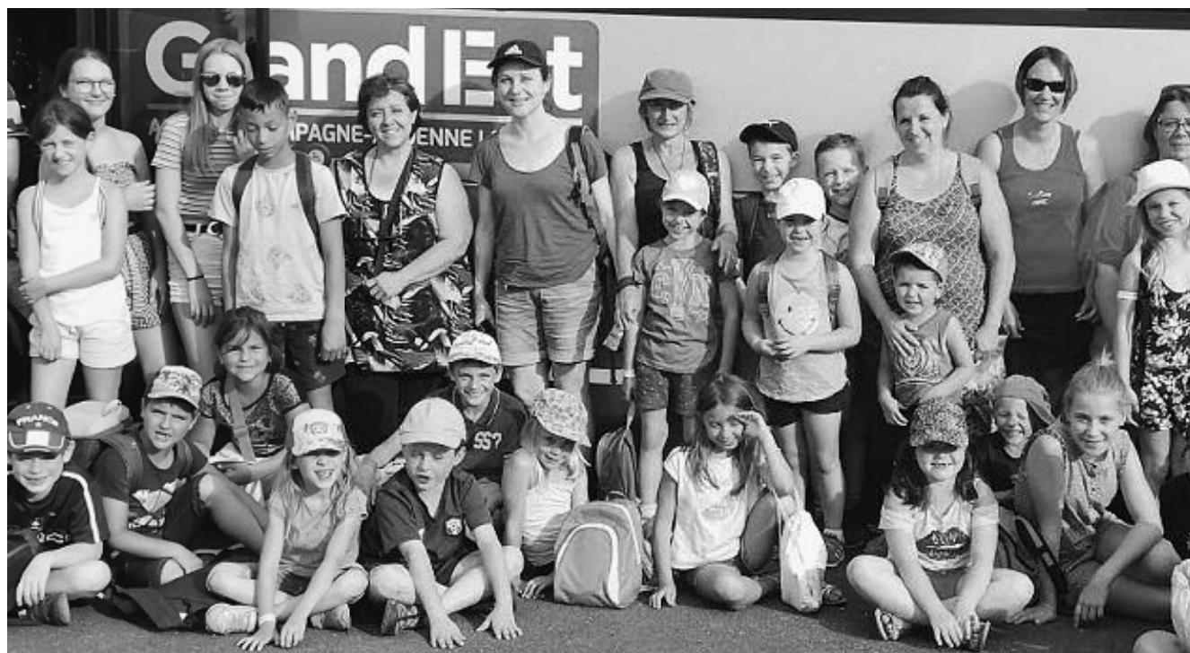
Journée de détente a Fraispertuis pour petits et grands