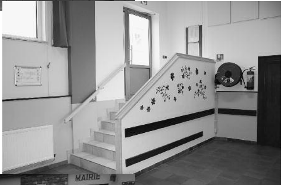
A la Salle des Fêtes : réhabilitation de l'escalier de l'entrée