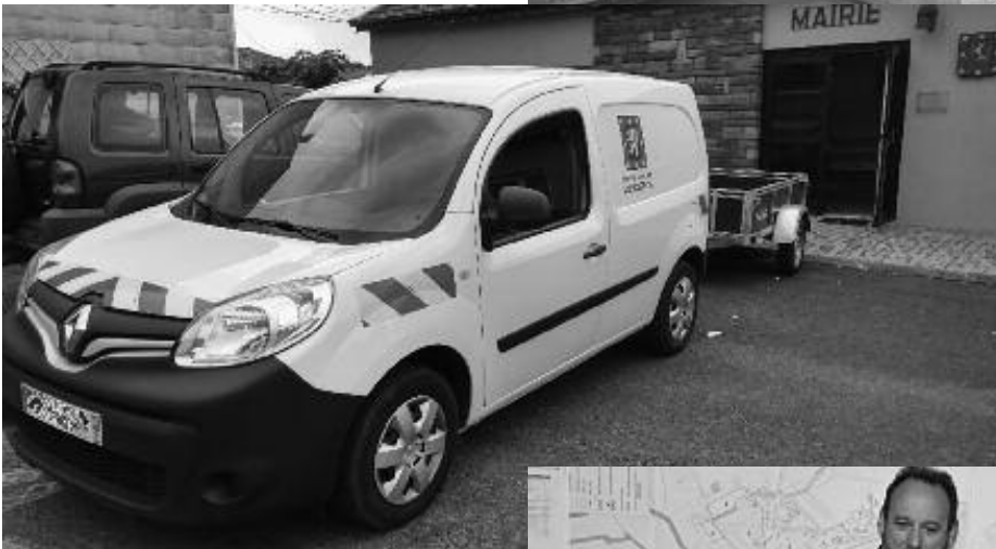
Achat d'un véhicule utilitaire et d'une remorque pour les services techniques