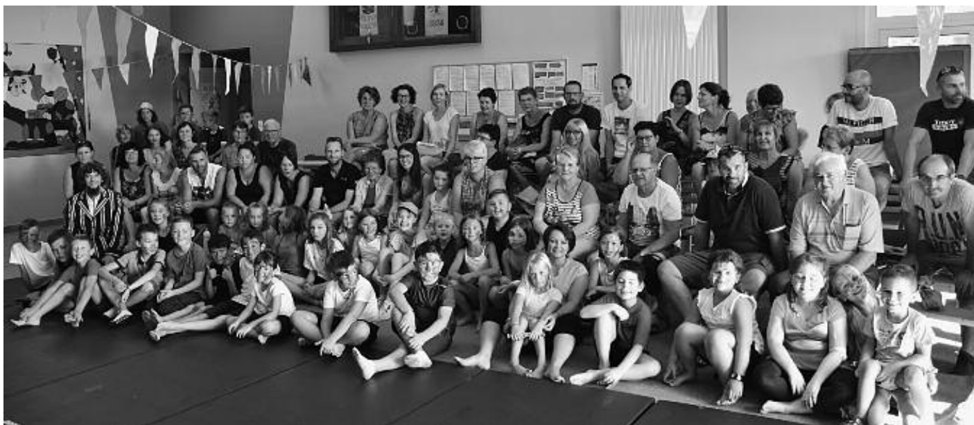
Les enfants après la représentation de leur spectacle.

Le rôle du péricolaire c'est de s'engager aux côtés des parents pour faciliter leur quotidien, mais aussi du personnel enseignant afin d'accompagner l'enfant tout au long de sa journée... sans oublier la place de l'élève lui-même au centre de toute cette agitation. S'aérer, bouger, partager, découvrir de nouvelles acti-