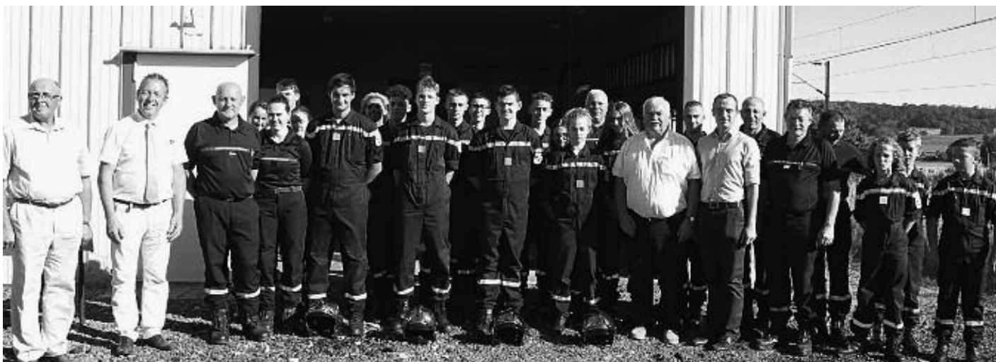
La cérémonie officielle de remise des casques marque symboliquement la fin de la formation initiale des jeunes sapeurs pompiers