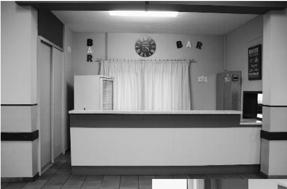
A la Salle des Fêtes : mise en peinture du bar