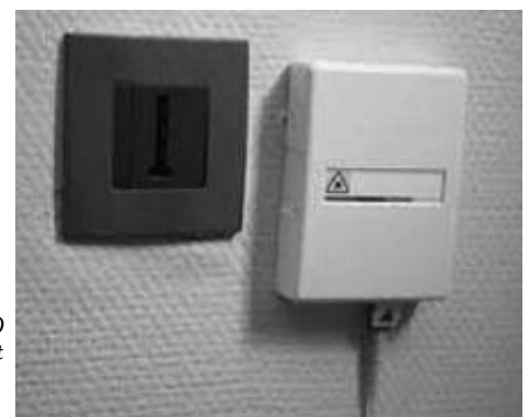
L'installation du PTO dans votre logement