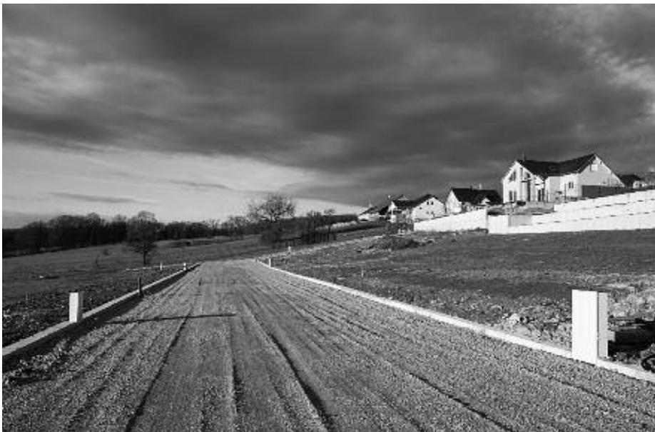
Lotissement des Prunelles : réalisation de 12 parcelles à bâtir

au lotissement des Perdrix (Impasse de la Chapelle) : voirie définitive et pose des enrobés,